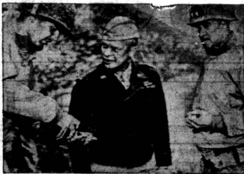
... gen. Dwight Eisenhower (centre) ir maj. gen. Omar N. Brodley (dešinėje) kaip perskirti šokinėjančią nacių miną, kuri nukreipta prieš žmones. Kai mina paliečiama, ji iššoksta keturias pėdas į orą ir exploduoja.