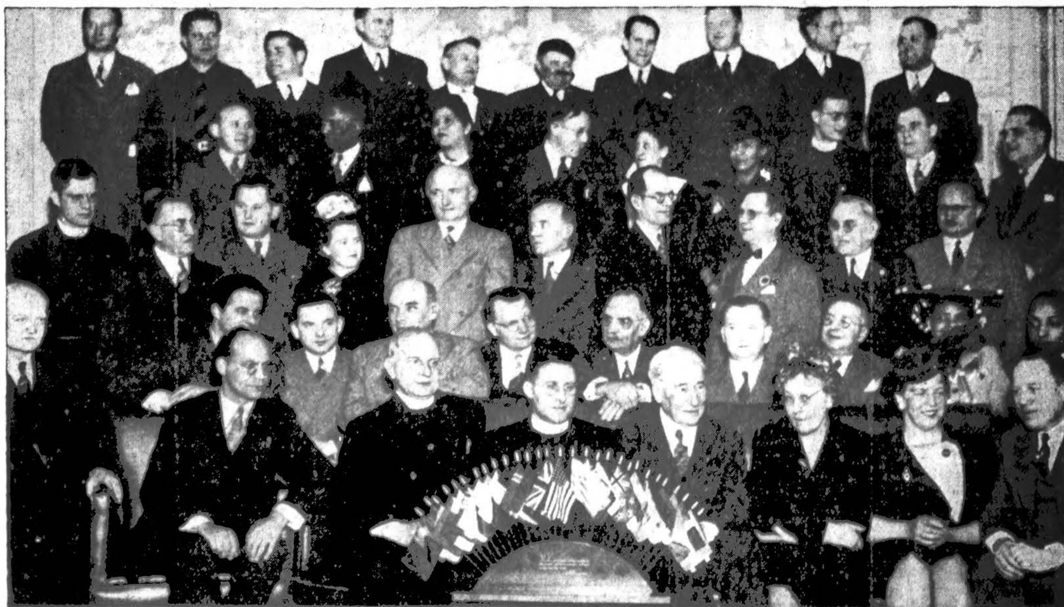
Chicago įvairių tautinių grupių vadai, susirinkę pritariti Chicago Herald-American rengiamoj "I am an American" dienoj Soldier Field, gegužės 16 d.