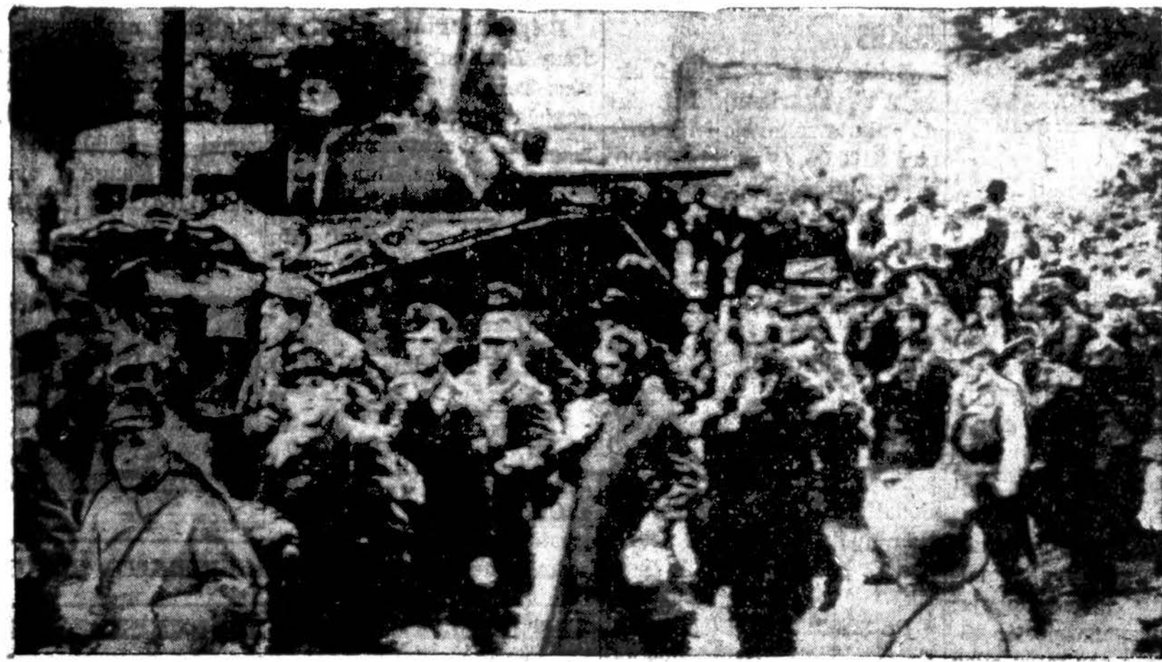
Tūkstančiai belaisvių ir daug karo įrankių pateko į sąjungininkų rankas, baigiant karo operacijas Tunis ir Bizerte. Čia matome ilgą eilę ašies belaisvių.