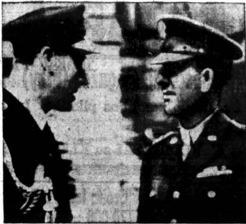
Lt. gen. Jacob L. Devers (dešinėje), Londone, perėmė žuvusio Lt. gen. Frank M. Andrews, U. S. Air vado pareigas, kuris vadovavo Europos karo fronte. Lt. gen. Devers pasidalino keliais žodžiais su lordu Louis Mountbatten, britų garsios komandos vada.