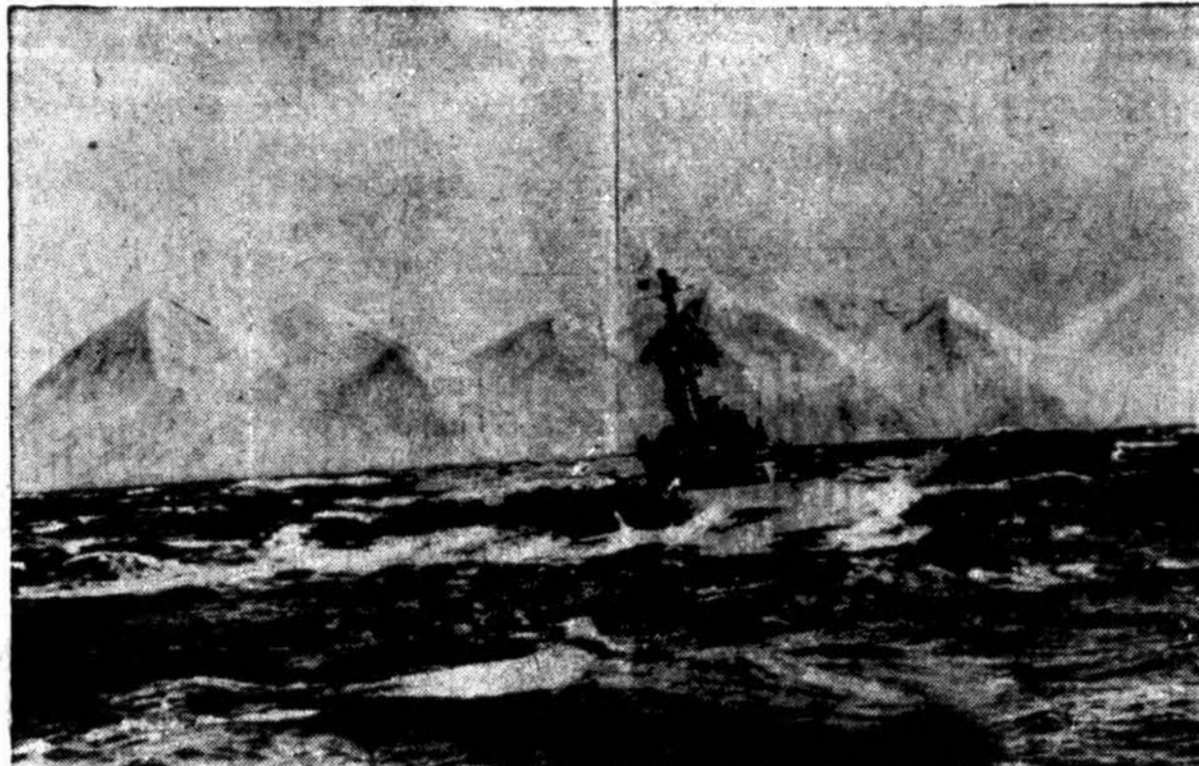
“Draugas” Acme photo

Reikėjo nugalėti oro ir geografinius sunkumus pirma negu pradėjo Amerikos armijos ir navy jėgos pulti japonų laikomą Attu. Čia matome pakrančių sargybinį laivą, mėtomą bangų. Laivas plaukia tarp Aleutians salų.