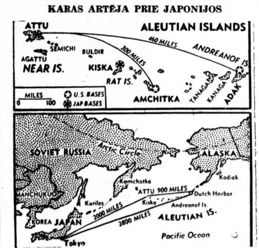
Kai amerikiečiai užėmė Amchitka ir dabartinės kovos dėl Attu užėmimo, Amerikos jėgos artėja prie japonų namų (žemės).

STOKHOLMAS, geg. 18. — Javų derliams pietinėj Europoj gresia pavojus, jei 14 dienų nebus sulaukta lietaus. Vengrijoj ir Rumunijoj siaučia sausras, kokių nebūta per 50 metų. O juk vienur ir kitur normaliais laikais javų valymas pradamas apie birželio galą.