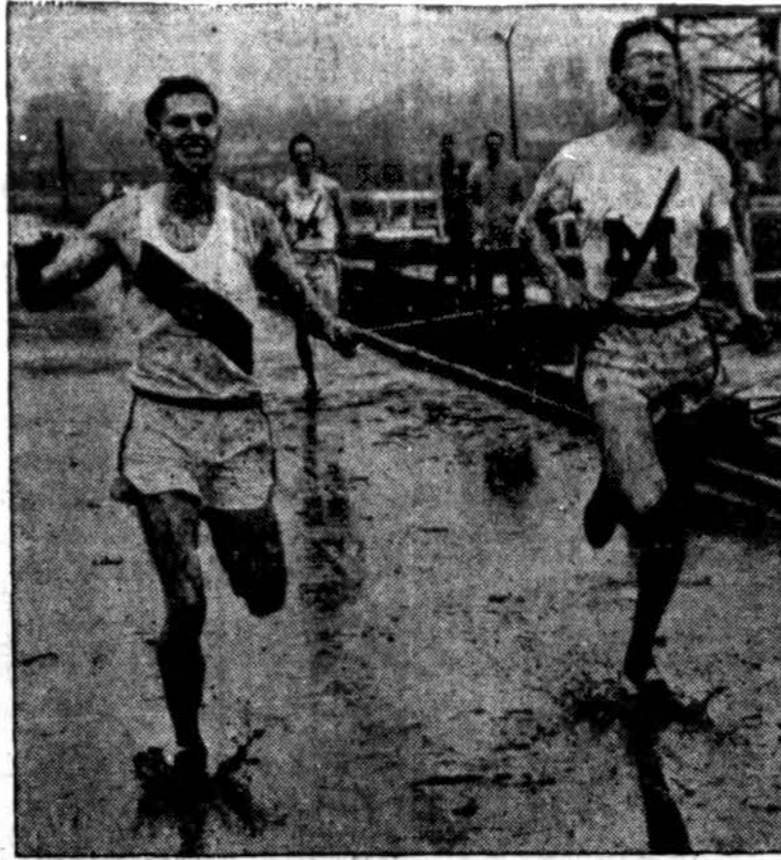
"Draugas"