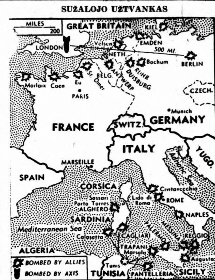
Laikė sąjungininkų užpuolimo iš oro Vokietijoje buvo sužalota užtvanka. Užtvanką sužalojo RAF. Daugiau kaip 300 milijonų tonų vandens pasiliejo Ruhr ir Eder slėniuose

PACIFIKAS. — Attu saloje, Aleutians, amerikiečiai pažangiuoja kovose su japonais, skelbia U. S. laivyno departamentas. Pareiškia, kad japonai atkakliai ginasi. Aleutians yra šiauriniame Pacifike. Pietiniam gi Pacifike sąjungininkų lakūnai ir toliau atakuoja japonų bazes, naikina jų lėktuvus ir skandina laivus.