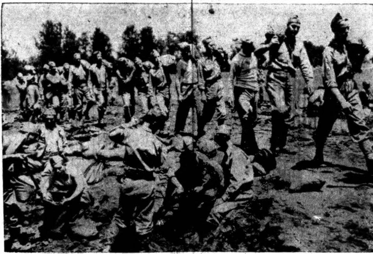
Missouri valstybės milicija krauna smėlio maišus prie užtvankos, netoli Gumbo, Mo., kur grėsia pavojus ją sulaaužyti.