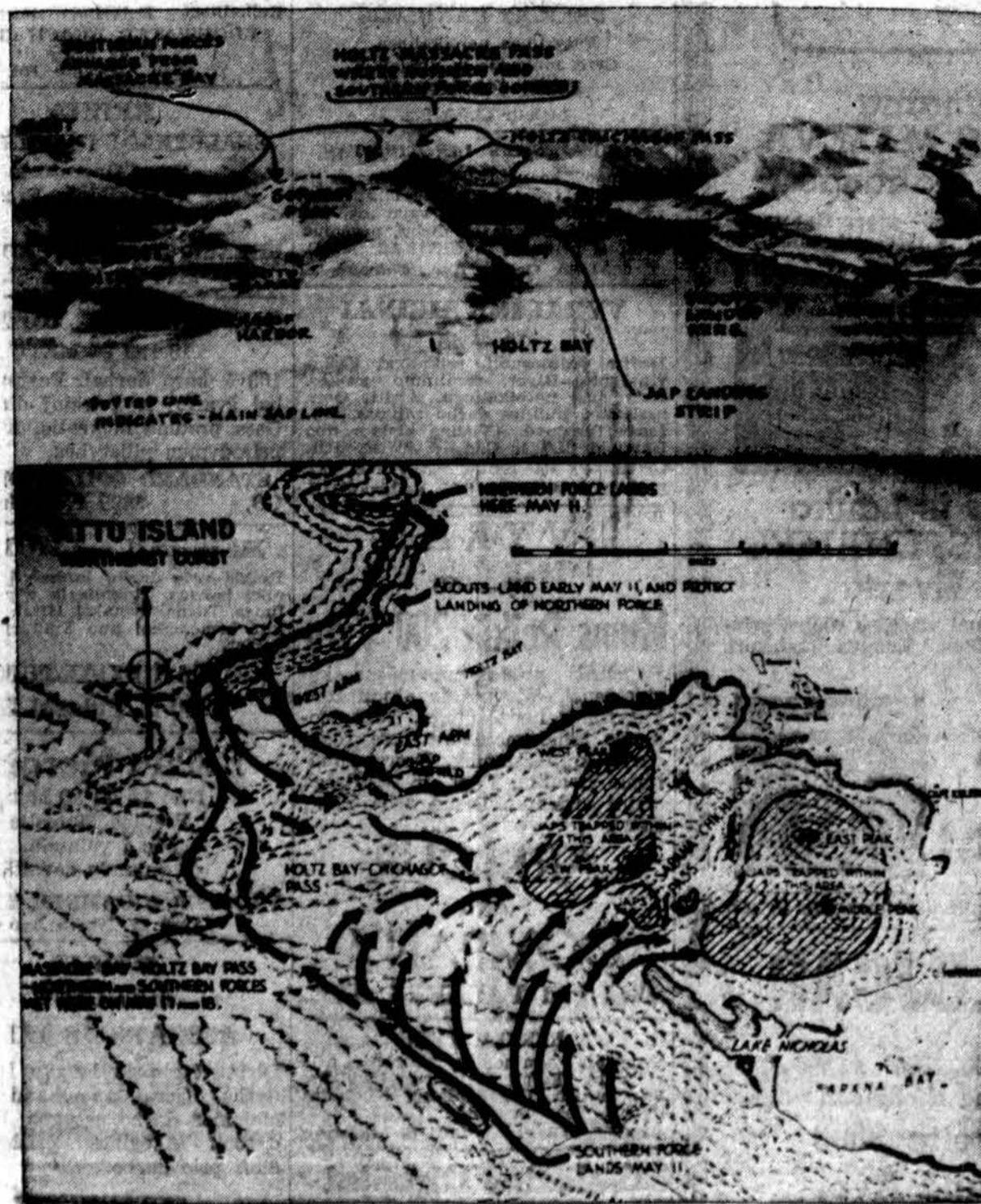
Foto-diagrama (viršuje) šiaurinės pusės Attu salos, kur amerikonų jėgos nustūmė japonų ginėjus skersai visą salą, iki jie atsidūrė užpakaliu prie jūros. Žemutinis žemėlapis parodo būdus atakos, kokius vartojo U. S. kariuomenė išsikėlė šiaurėje ir pietuose ir susijungė sustiprinta ataka spaudžia japonus šiaurės rytų link į jūrą.