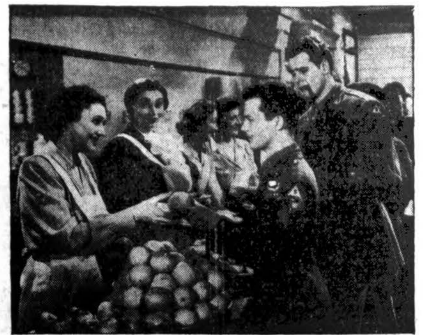
Katharine Cornell, first lady of the theatre, makes her movie debut — the most famous in the history of the movies. Playing herself in Sol Lesser's United Artists picture, "Stage Door Canteen," she appears in an impromptu scene from "Romeo and Juliet" with Lon McCallister.