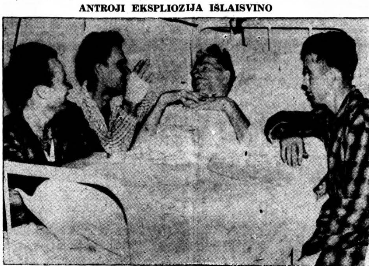
ANTROJI EKSPLOZIJA IŠLAISVINO

WASHINGTON. — Sino-Koreans People's lyga gavo žinių, kad japonai planuoja šiemet įsiveržti į J. A. Valstybes.