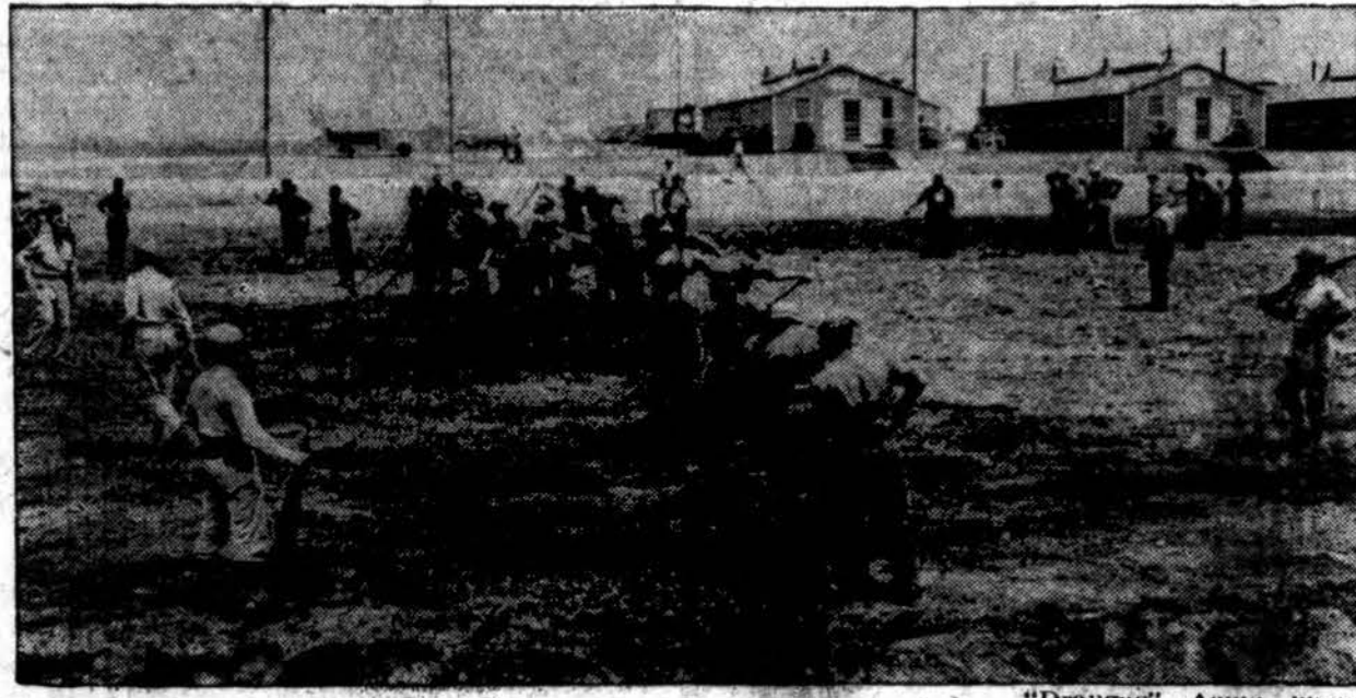
Atvežus karo belaisvius šon šalin, jiems duodama dirbti įvairūs naudingi darbai. Čia italai karo belaisviai prižiūri “pergalės daržus” (victory gardens) šalia Camp Atterbury, Ind., kur jie laikomi stovykloje. Italai ir vokiečiai laikomi atskirose dalyse.