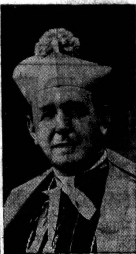
J. E. Ark. John J. Cantwell

“Per kontinentus ir per didelius vandenis, per tyrus ir per žaliuojančius laukus, per klonis ir kalnus važiuo- jau senas lietuvis kunigas ieškodamas savo žmonių, kurie čia gyveno kaip ir ap- leisti. Be bažnyčios, be or- ganizacijos. Atvažiuo jis čia, kad jums padėtų, kad per motiną Bažnyčią jus su- vienytų, kad testų gražias jūsų tautos tradicijas, palai- kytų jūsų prigimtą kalbą, kad jūs ir jūsų vaikai neuž- mirštų savo kalbos, savo gražių papročių, savo dainų ir giesmių. Šventindamas šią vietelę sakau jums: te- gul būna čia jūsų kad ir ne- skaitlingos grupelės lietu- viškumo židynys. Tegul būna čia namai, kur jūsų vaikai išmoks savo tėvų kalbos ir dainas ir visa, kas tik yra kilnu ir gražu. Jūsų tėvų yra šventa pareiga tai savo vaikams duoti. Jūsų pareiga yra jiems įkvėpti pasididžia- vimo jausmą, iš kur jie yra kilę, kas buvo jų tėvai ir ko- kiam žemės kampeliui jie priklauso. Žmonės ir tautos, kurie neturi to jausmo, ne- brangina gražių tradicijų ir papročių, greit išnyksta ir tai reiškia, kad jie nebuvo