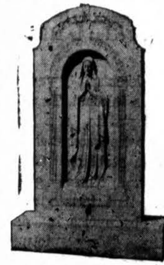
Mūsų pastatytas TEVAMS MARIJONAMS

deral Bureau of Investigation, pareiškė, birželio 22 dieną, kad jo biuras laike 11 mėnesių, baigiantis gegužės 31 dieną, surado 413 asmenų, kurie kaltinami už neteisėtą kariškų rūbų nešiojimą.