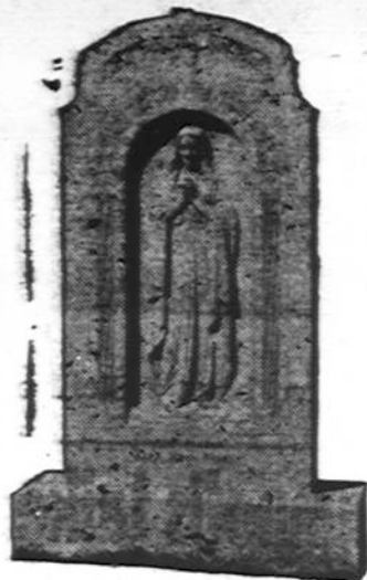
Mūsų pastatytas TEVAMS MARIJONAMS

Irodomo, jog stenografijos (trumpraščio) sistema nėra naujas dalykas. 63 metais prieš Kristaus gimimą panašiu būdu rašydavę.