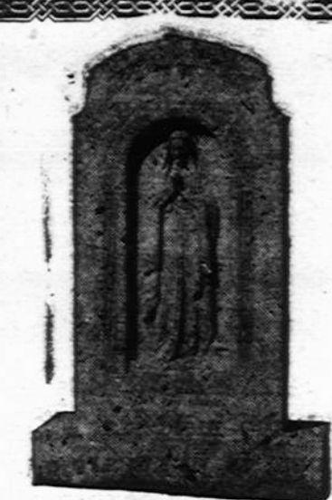
Mūsų pastatytas TEVAMS MARIJONAMS

DDYSIS Ofisas ir Dirbtuvė: 527 N. WESTERN AVE. (Netoli Grand Ave.) PHONE: SEELEY 6103