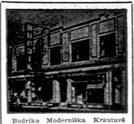
Budriko Moderniška Krautuvė

Kas girtybėj rūgsta, tam duonos trūksta.