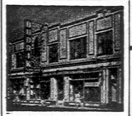
Budriko Moderniška Krautuve

Visa virtinė laboratorijų ir mokslininkų daro visokių bandymus su stiklu ir nepraeina tos dienos, kad pasauliui nebūtų pranešama apie naujus atradimus stiklo pramonėje, apie naujus pritaikymus stikliui ir stiklo dirbiniams.