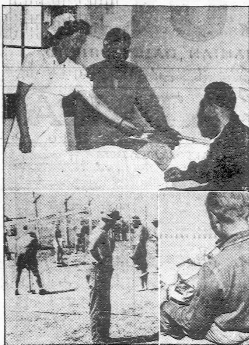
Vaižde rodoma kaip kapelionai lanko vokiečius belaisvėje, Camp Buckinbridge, Kentucky. Karo departamentas sako, kad vokiečiai "karo belaisviai". Sv. Rašte sakoma "Aš būvau belaisvis ir tu mane aplankei".

tisto asmenį. Manoma Hartforde turėti koncertą, tad tarėmės su kompozitorium. Vėliau paskelbsime vizą programą.