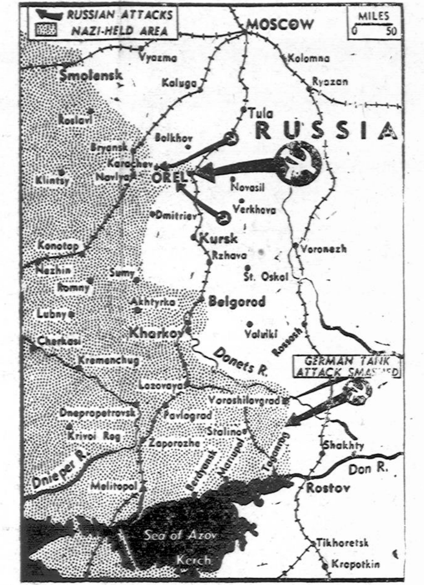
Pranešama, jog vokiečių kariuomenė bėga iš Orel miesto, per 13 mailių platumo koridorių, ir palieka didelius kiekius atsargų ir nesugadintų ginklų.