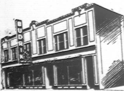
Budriko Moderniška Krautuvis

Radio Programai leidžiami Budriko Krautuvis per 14 metų: WCPL 1000 k.; Sekmadienio vakare 9 valandą. WHFC 1450 k. Ketvirtadienio vakare 7 valandą.