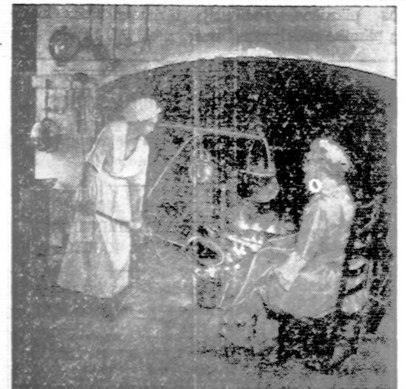
Kitchen grease was as important in Colonial days as it is now. The Continental Army needed fat for munitions in 1776 as our troops need it today. Housewives can take a tip in household thrift and patriotism from this picture taken in the kitchen of the Governor's mansion in Williamsburg, Virginia, where everything has been restored exactly as it was when our country was young.

Atsakymas G. P. B. — Tai nėra liga, bet blogas įprotis. Didelių pavojų nėra, bet nervų dilginimas nėra sveika nervų sistemai; jis gali užaugti neurasteniką. Kaip gelbėti? Kartais api-piaustymas pagelbsti, bet nevisada. Kad miegodamas neapsiverstų kniupsčias, yra pediatrinės juostos, kurias užmaunama ant šlaunų ir liuosai priišama prie vygės kraštų. Daugiau informacijų gali'e gauti asmeniškai nuėjus pas daktarą.