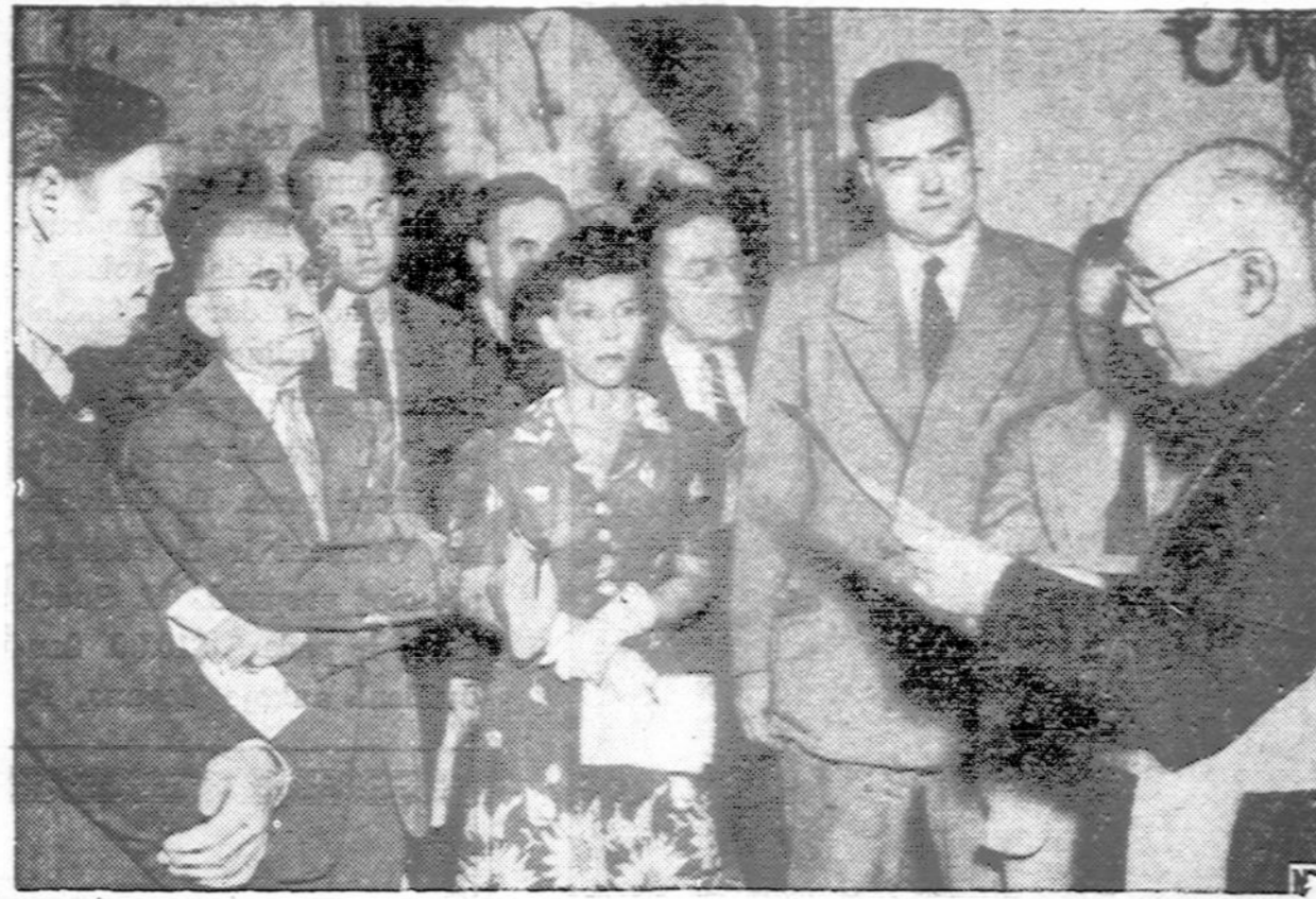
New Yorko arkivyskupas Francis J. Spellman, vikaras kariškų jėgų, kalbasi su spaudos atstovais. Jis beveik šešis mėnesius lankė Amerikos kariškas stovyklas užjūryje, keliavo 45,000 mailių. Jis buvo taip pat priimtas popiežiaus Pijaus XII.