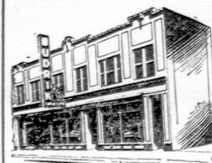
Budriko Moderniška Krautuvių

Radio Programai leidžiami Budriko Krautuvių per 14 metų: WFCL 1000 k. Sekmadienio vakare 9 valandą. WHFC 1450 k. Ketvirtadienio vakare 7 valandą.