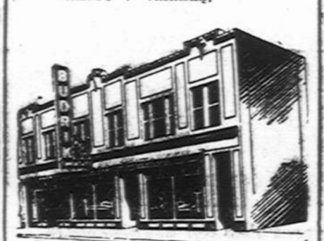
Budriko Moderniška Krautuvė

Radio Programai leidžiami Budriko Krautuvės per 14 metų: WCFL 1000 k. Sekmadienio vakare 9 valanda. WFHC 1450 k. Ketvirtadienio vakare 7 valanda.