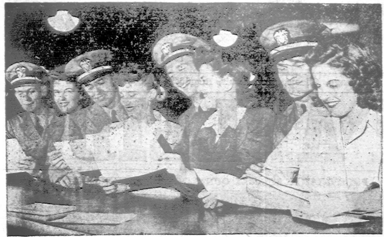
Penkiolika jūrų kadetų, kuriems buvo uždrausta vestis iki nebaigs reikalingo mokslo Officer's Training School, Northwestern universitete, nutarė baigus mokslą susituokti "in corpore". Kaip tarė, taip ir padarė. Čia matome tik dalį jūrininkų su savo sužieduotinėmis.

mui kasdien reikia išleisti 1,700 dolerių. Žiemą per dieną anglių sudeginama 20 tonų. Neturtingieji iš miesto veltui geuna gydymą, kas sudaro apie 12,000 dol. metams išlaidų.