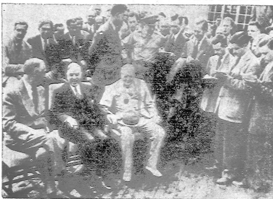
Prez. Roosevelt, Kanados ministrų pirmininkas Mackenzie King ir britų ministrų pirm. W. Churchill Quebeco konferencijos pabaigoje priėmė ir spaudos atstovus.