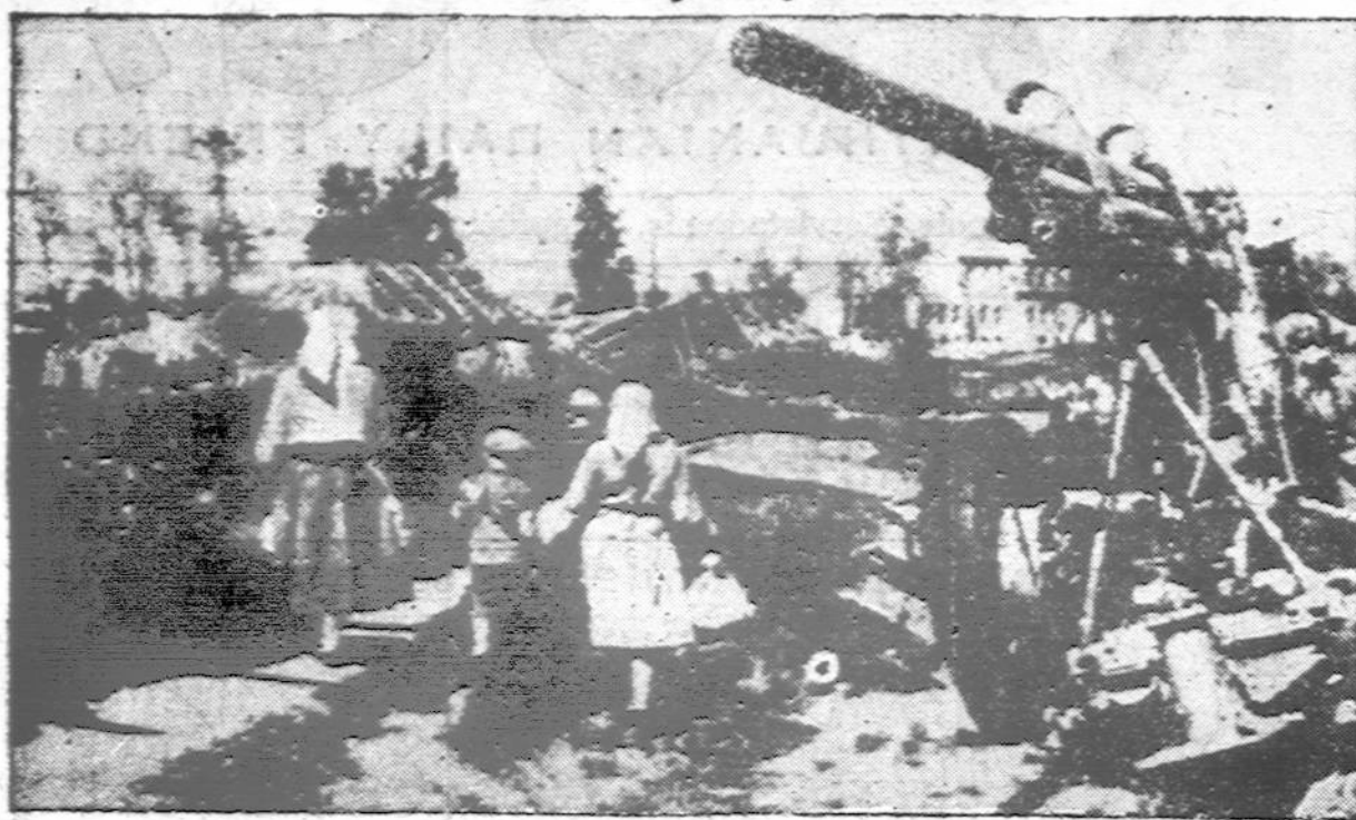
Pabėgėliai iš Bryansko fronto, Rusijoje, grįžta į savo gyvenamąsias vietas — kaimus, kuriuos iš vokiečių atėmė raudonoji armija. Dešinėje matosi vokiečių palikta kauluolė.