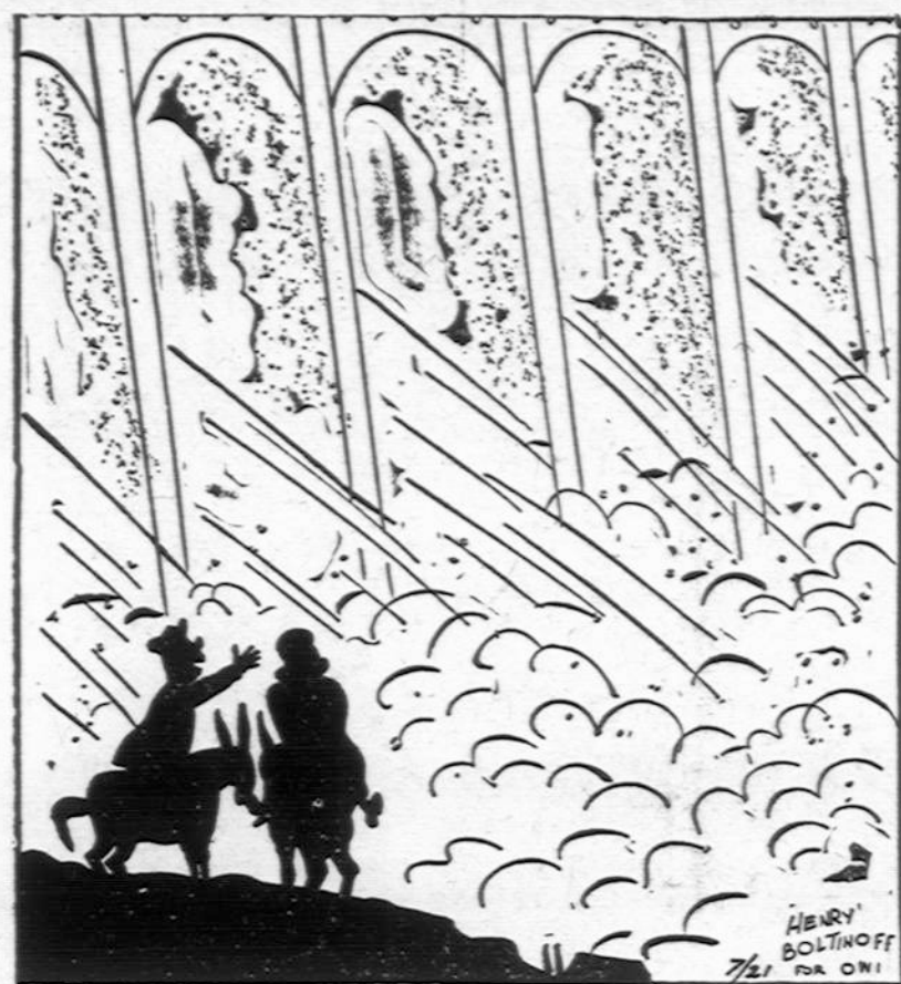
"ALL IT MAKES ME THINK OF, DEAR, IS HOLDING BACK INFLATION!"

Todėl, gerbiamųjų skaitytojų prašome gerai įsitęti, kad šiemet labdarių rudeninis piknikas bus sekma-dienį, rugsėjo 5 d. aukščiausiai minėtame ūkyje. Piknikui vieta parinkta ir prirengta. Kuopos jau viską suruošė, kad atvykusiems svečiams nieko nepritrūktų. Kad sve-