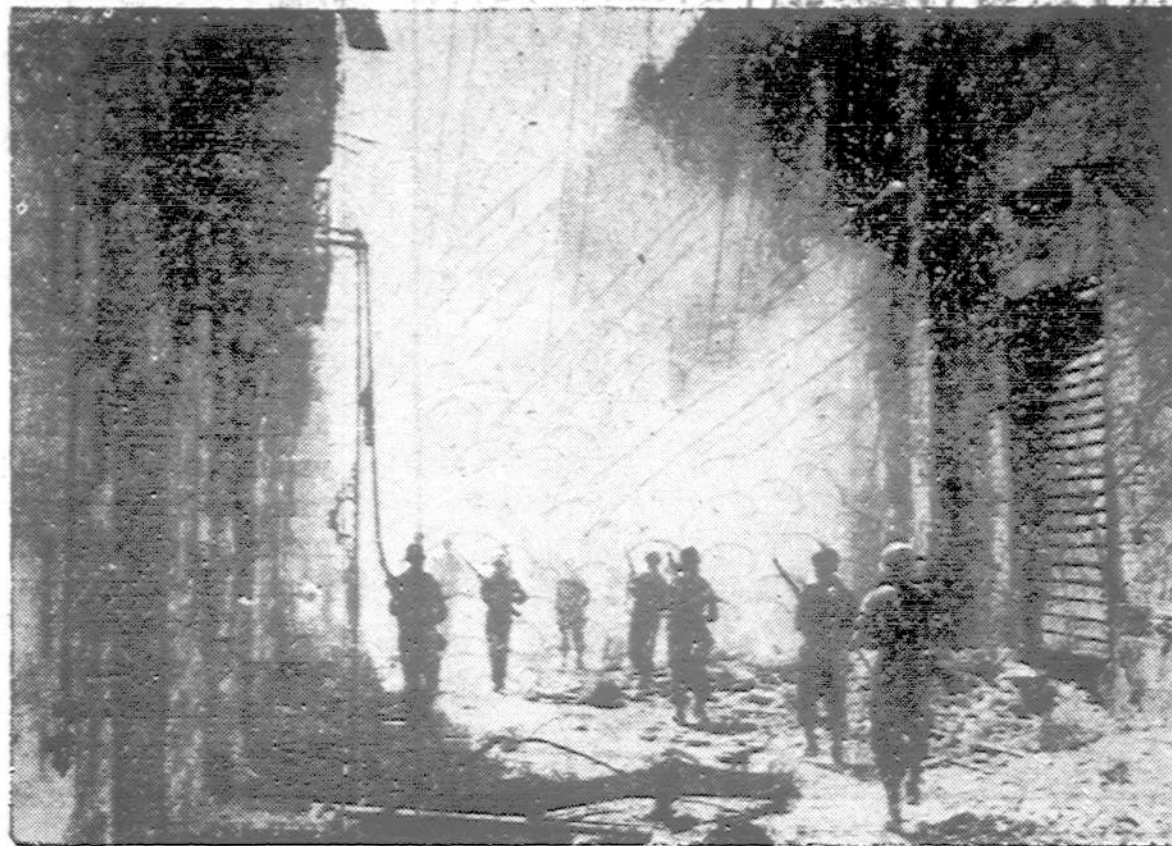
Vienam Acme fotografui pavyko nuotraukti labai dailų paveikslą aliantų užimam Messina mieste. Saulės spinduliai, pro dūmų debesis ir griūvėsius duoda gražų vaizdą. Bet koks šiurpus sunaikinimo vaizdas anksčiau vieno gražių Sicilijos miestų.