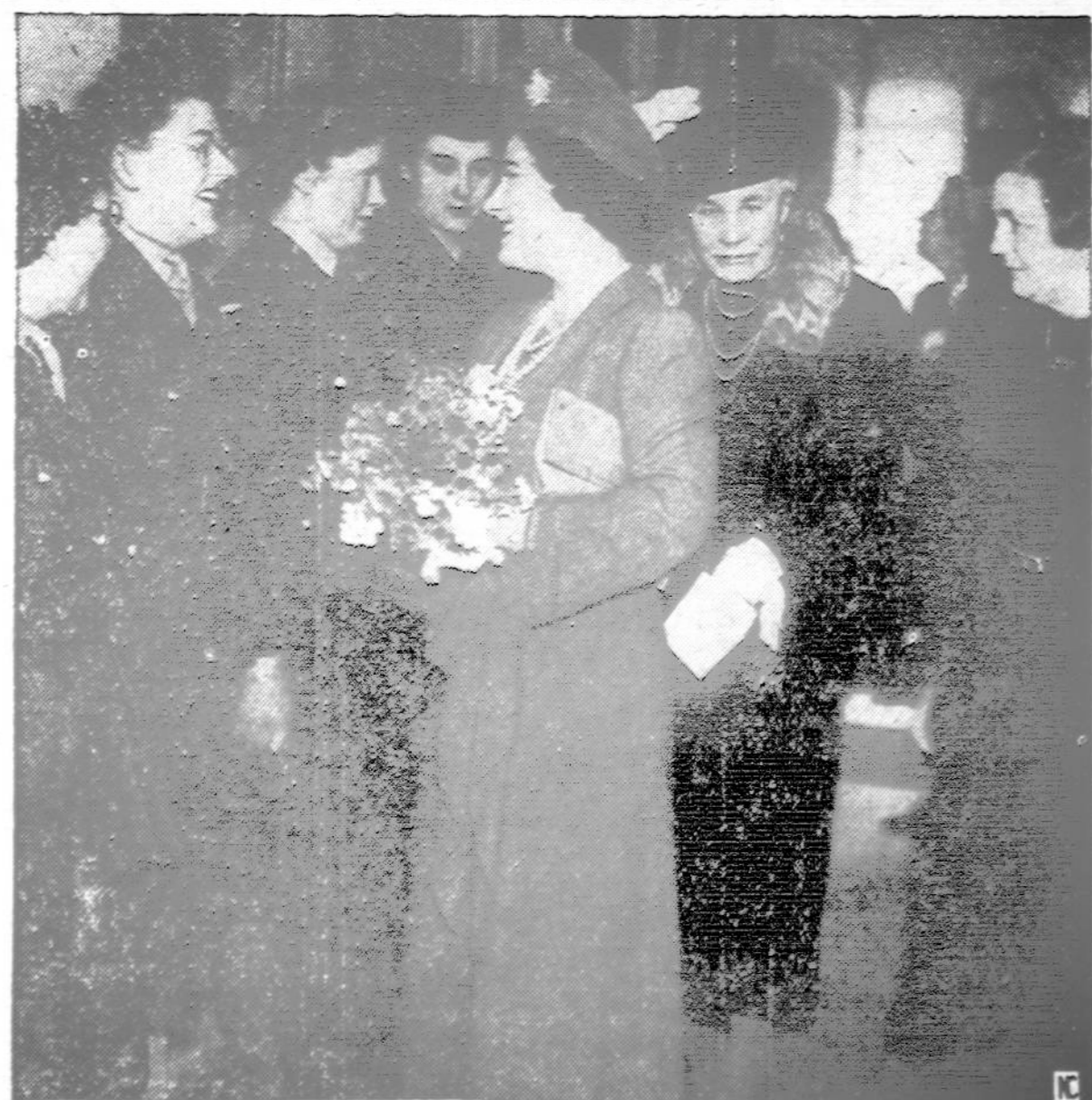
Anglijos karalienė Elzbieta lanko katalikų klubą Londone ir džiaugiasi dideliais katalikų moterų darbais, dirbamais karo reikalams.