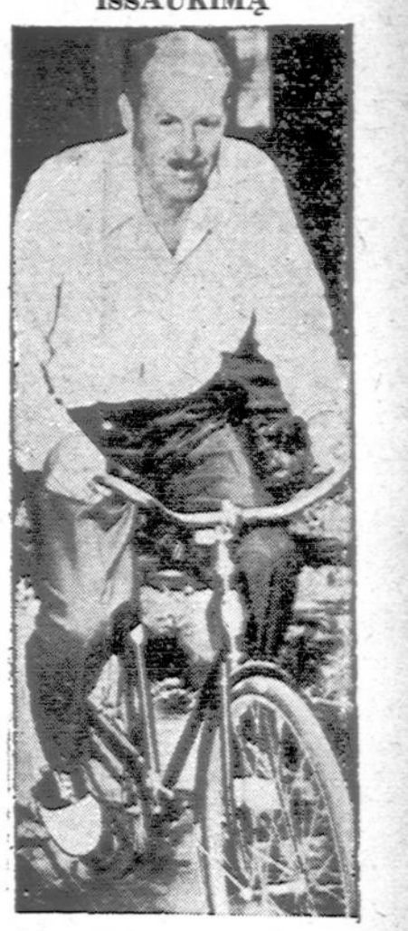
Drew Pearson, 46 metų amžiaus, Washingtono laikraštinkas, pasiryžęs priimti Henry Fordo 80 metų amžiaus, iššaukimą, kad patikrinus, kuris judviejų yra fiziniai sveikesnis-stipresnis. Pearson komentavo, kad Fordo sveikata šiuo metu eina silpnyn, gi Fordas, pažymėjęs nežinojimą, kokia yra Pearsono sveikata, pareiškė, jog jis niekuomet nesijautęs taip gerai, kaip dabar.