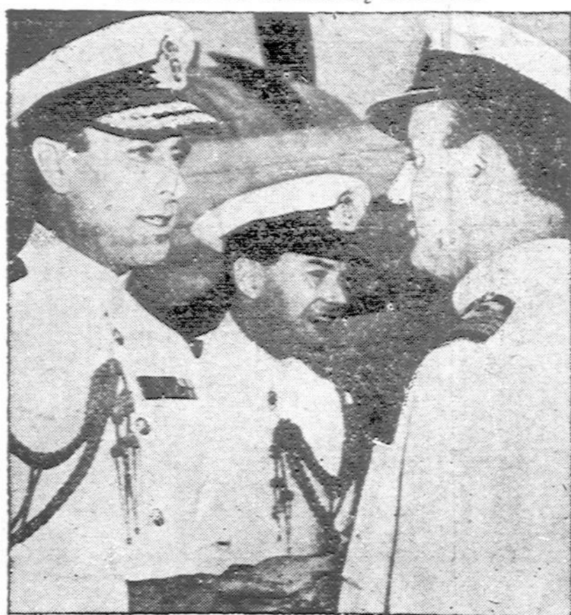
Lord Louis Mountbatten (kairėje), paskirtas vyriausiu sąjungininkų vadu pietvakarinėj Azijoje, atvykęs į Washington pasitarimams. Aerodrome jis sutinkamas vieno britų jūrų kapitono.