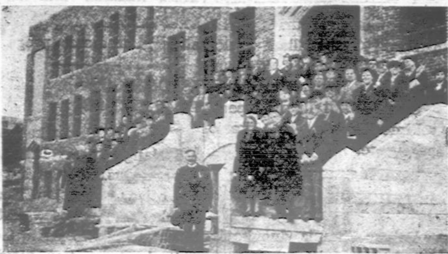
Sv. Pranciškaus Akademija ir mokinių grupė

1939 m. nupirktas naujas autobusas akademijai.