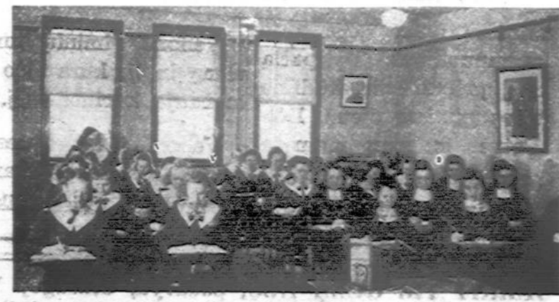
Vaiždelis iš Sv. Pranciškaus Akademijos

1940 m. pradėta statyba li darbai stovi prieš akis ir naujos mergaičių akademi- jos.