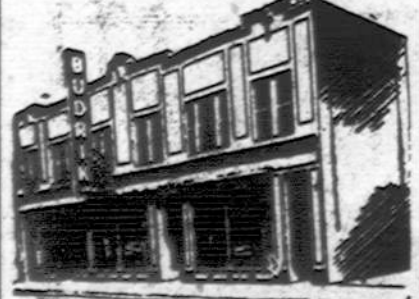
Budriko Moderniška Krautuvė

Radio Programai leidžiami Budriko Krautuvės per 14 metų: WCFB 1060 k. Sekmadienio vakare 9 valanda. WHFC 1450 k. Ketvirtadienio vakare 7 valanda.