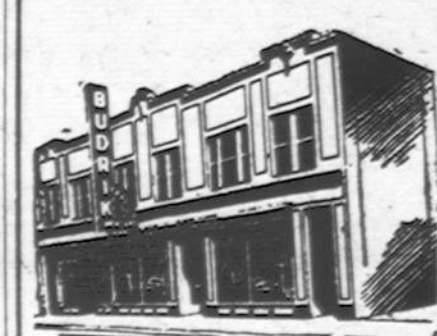
Budriko Moderniška Krautuvs

Radio Programai leidžiami Budriko Krautuvs per 14 metų: WCFE 1000 k. Sekmadienio vakare 9 valanda. WHFC 1450 k. Ketvirtadienio vakare 7 valanda.