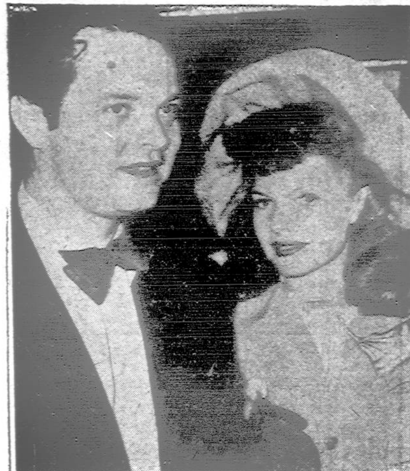
Artistas-magikas Orson Welles ir Rita Hayworth po pirmojo pasimatymo suėję moterystėn Santa Monica, Cal.