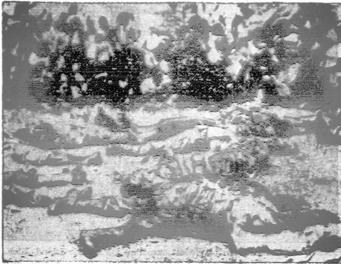
Amerikos paratruperis žuvs nuo priešo kulkos pirmose invazijos Sicilijon dienose.