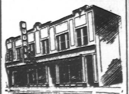
Budriko Moderniška Krautuvis

Radio Programai leidžiami Budriko Krautuvis per 14 metų: WCFB 1000 k. Sekmadienio vakare 9 valandą. WHFC 1450 k. Ketvirtadienio vakare 7 valandą.