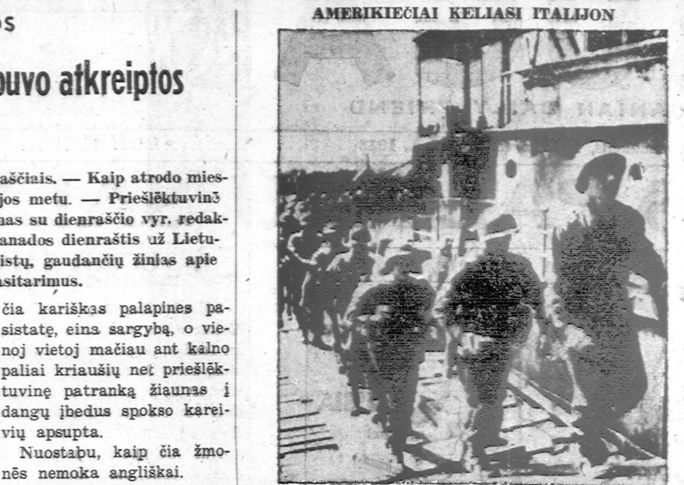
Iš vieno Sicilijos uosto Amerikos kariuomenės (rangers) keliai per sąsiaurį Italijon, kad apvalius ją nuo vokiečių.

čia kariškas palapines pastatę, eina sargybą, o vienoj vietoj mačiau ant kalno paliai kriaušių net priešlėktuvinę patranką žiaunas į dangų įbedus spokso kareivių apsupta.