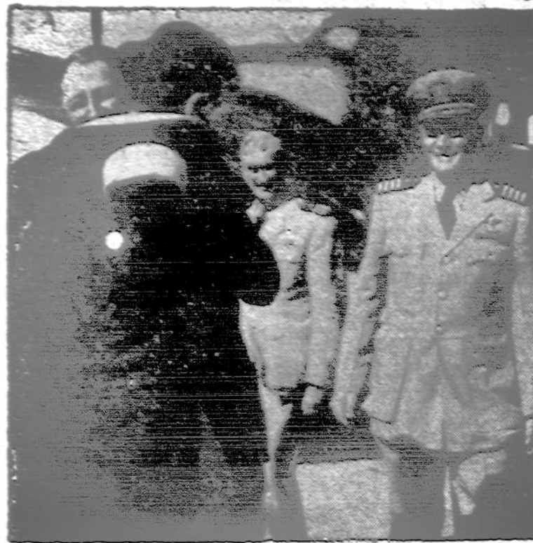
Vice prezidentas Henry Wallace ir Navy ministras Frank Knox netikėtai susitikę Glenview (netoli Chicago) kariuomenės stovykloje. Wallace buvo atvykęs į Chicago kalbėti pokariniams klausimais.