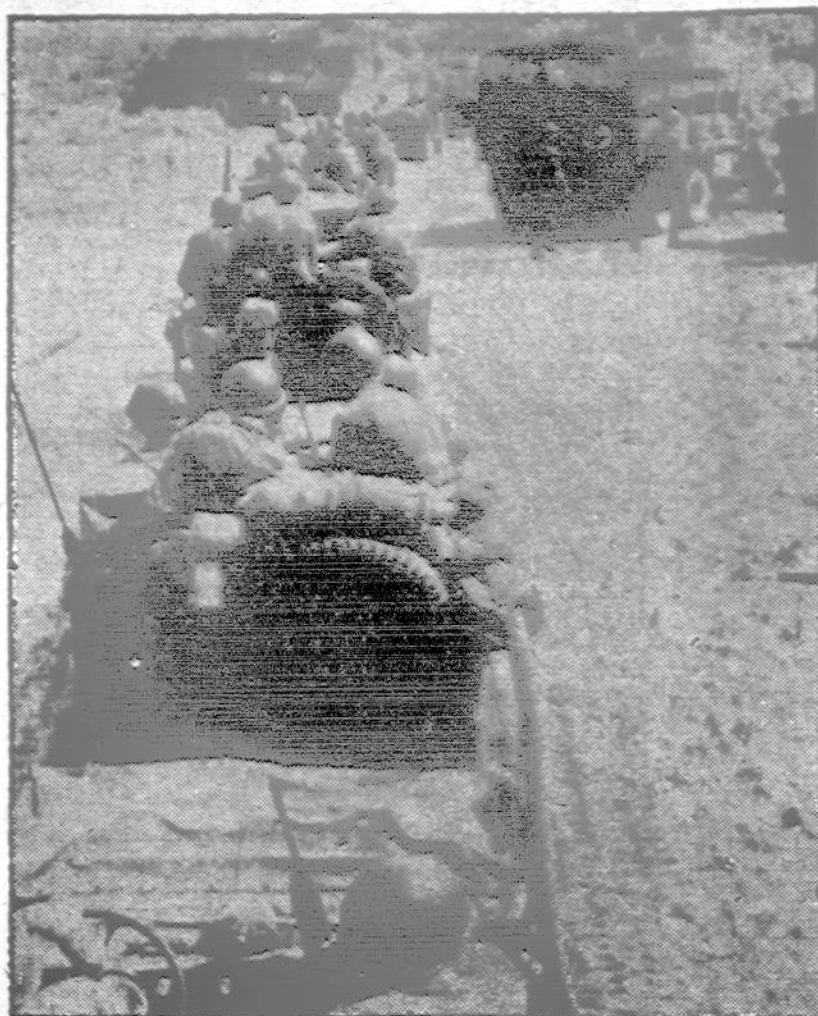
Dalys Amerikos Penktosios Armijos sekmingai išlaipintos Italijoje, ilga eile traukia gilumon krašto, kad ji apvalyti nuo nacių.

Kane kauntės farmoje, netoli Batavia, pasikorė vyras 65 metų amžiaus, pereiną pirmadienį. Jo kūnas buvo rastas kiaulių name.