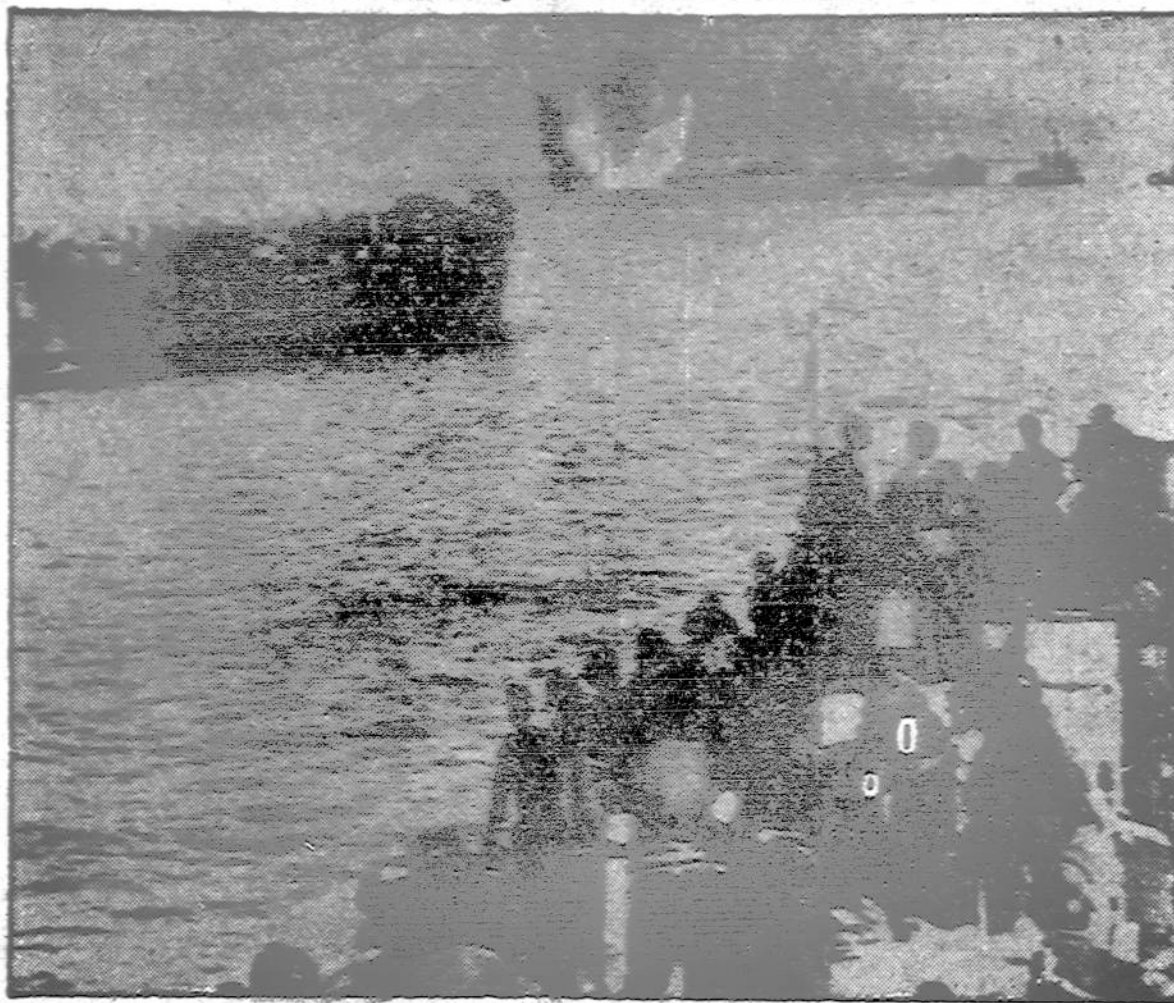
Pilni laivai ir tankai Amerikos Penktosios Armijos iš Sicilijos keliasi Italijon nežūrint puolimo vokiečių lėktuvų, kurių paleistos bombos sprogsta aplink.