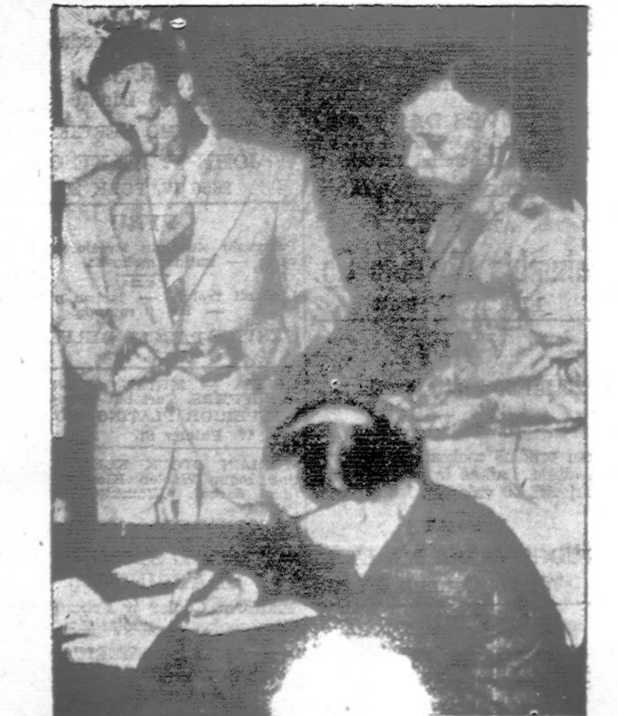
Ats. ovi Italijos ir aliantų vyriausybių pasirašo paliaubas, kuriomis Italija besąlyginiai pasiduoda aliantams. Iš dešinės į kairę: Italijos užsienų reikalų ministras; majoras gen. W. B. Smith, viršininkas A. F. J. Q. ir U. S. A. štabų; ir gen. G. Castelano, militaris Italijos atstovas, kurs pirmas pasirašo pasidavimo dokumentą.