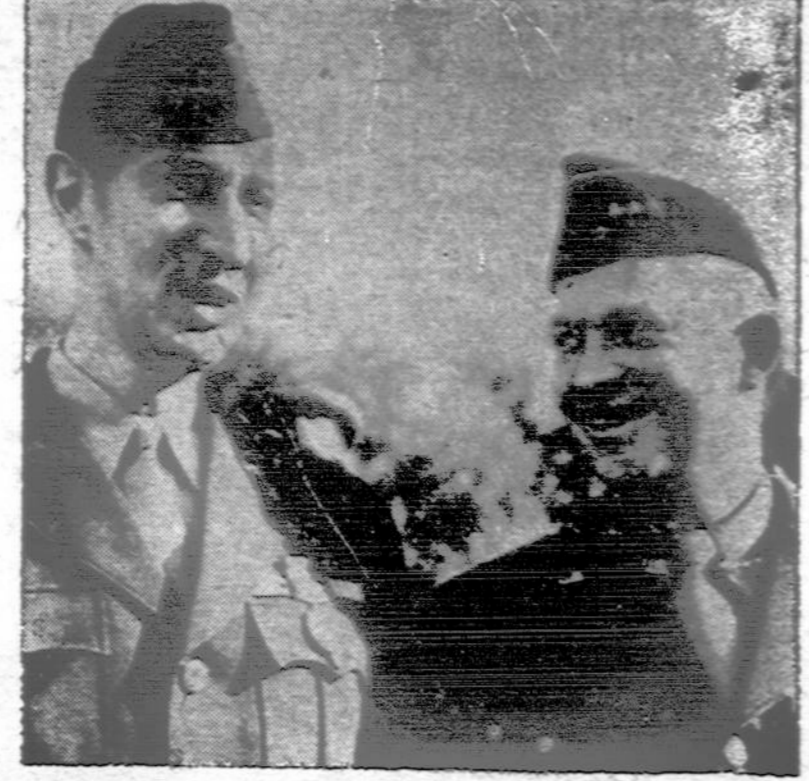
Amerikiečiai militariniai vadai, būtent gen. Dwight Eisenhower, vyriausias aliantų komendantas karinių veiksmų Italijoje, ir gen. Mark Clark, Amerikos Penktosios Armijos vadas. Gen. Clark yra jauniausias Amerikos generolas, vos 47 m. amžiaus, bet jau pasižymėjęs kariniuose veiksmuose. Jam vadovaujant amerikiečiai, perplaukę sąsiaurį, užėmė Neapolį ir, stumdami priešą, veržiasi Italijos gilumon.

Jungtinių Amerikos Valstybių 160 nacionalinių parkų turi daugiau kaip 176,000,000 akerių.