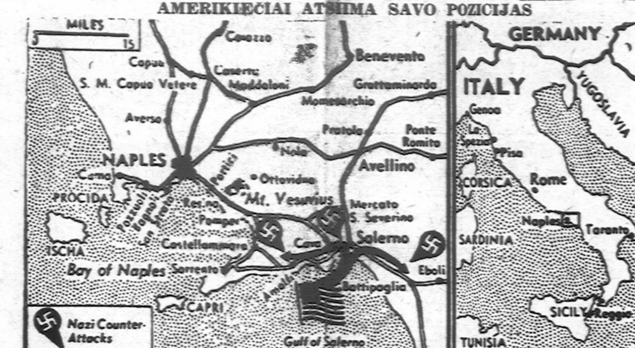
Desperatinės nacių kontratakos Salerno, Italijoje, apylinkėje, kaip pranešama, kai kuriose vietose pastūmė Amerikos Penktąją Armiją, kuriai vadovauja pasižymėjęs gen. Clark, arčiau jūrų. Naciai skelbė, kad tūkstančiai amerikiečių žuvo ir tūkstančiai paimti nelaisvėn. Bet tai greičiausiai buvo paprasta vokiška propaganda.