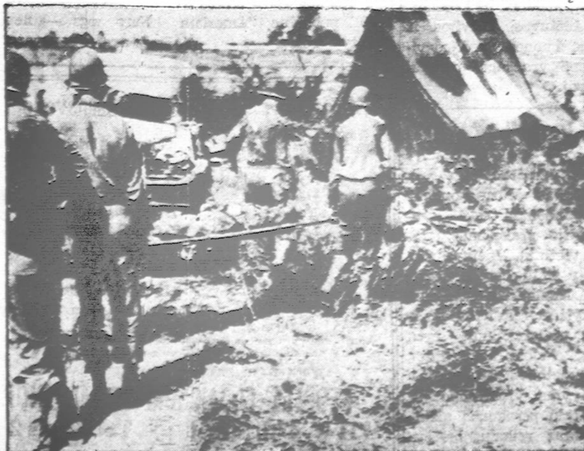
'Sužeistas Amerikos kareivis invazijos Italijon metu nešamas į pirmosios pagalbos stotį.