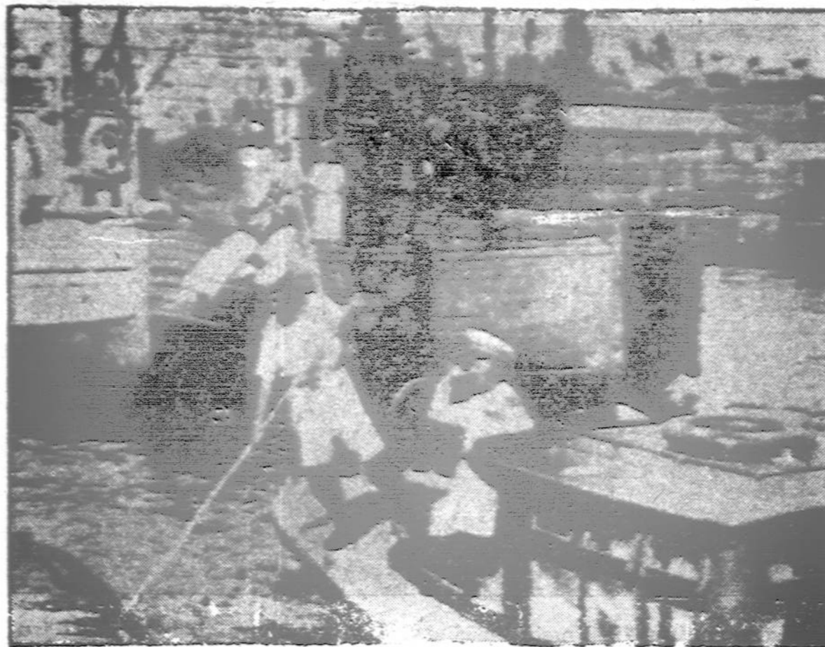
Admirolas D'Zara, komendantas Italijos karo laivyno, Maltoje išlipa iš vieno karo laivo, kad prisistatytų admirolui Sir Andrew Browne Cunningham, aliantų karo laivyno Viduržemio jūroje vyriausiam vadui, ir perduoti likučius Italijos karo laivyno, kurie atplaukė į Malta ir kitus aliantų uostus.

kreditą už visų kunigų dar-bus. Bet organizotas dar-bas duoda daugiausia vaisių, ir kunigų organizuotė rei-škiasi per Kunigų Vienybę.