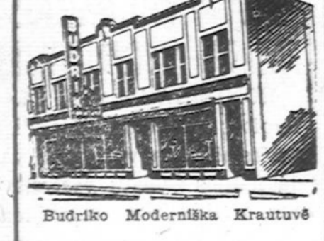
Budriko Moderniška Krautuvis

Radio Programai leidžiami! Budriko Krautuvis per 14 metų: WCFL 1000 k. Sekmadienio vakare 9 valandą. WHFC 1450 k. Keturtdienio vakare 7 valandą.