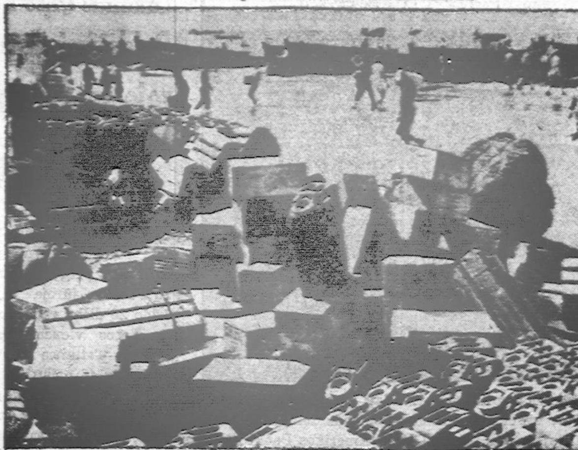
Išlaipinę Italijos Amerikos Penktąją Armią nenutraukiamu ryšiu plukdomi įvairūs karo įrankiai ir kariuomenės reikmenys. Atvaizde parodoma tūkstančiai dėžių, iškrautų iš laivų Italijos pakraštį, kad tuojau pri statyti žygiuojančiai pirmyn kariuomenei.