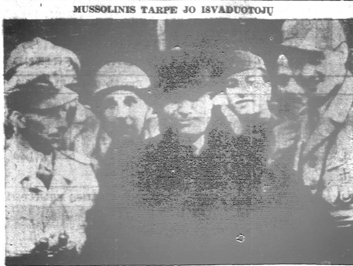
MUSSOLINIS TARPE JO ISVADUOTOJU Blausi šypsena pasilikus tikrai seniau buvusiam didingam veide Italijos dučės Mussolini. Ir toji šypsena pasireiškė tikrai nacių parašutistams ji išvadavus iš nelaisvės. Viskas kitas dingio, kaip sapnas. Ši tutrauka atšlysta iš Švedijos.

Grįždami sustojame prie Montmorency kriuklio, kur vanduo, krinta net iš 274 pėdų aukščio, tik čia ne tiek daug vandens, tai išpūdis mažesnis, negu Niagara