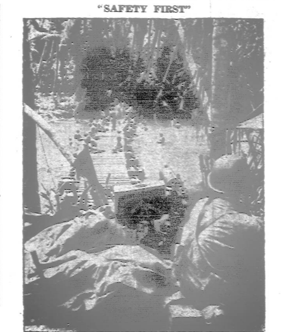
Vienoj Pacifiko salų upėj smagiai vėsinasi Amerikos kariuomenės inžinierių dalinys. Ant aukšto kranto kareivis su kulkosvaizdžiu juos saugo nuo japonų sniperių.

Japonai desperatiškai kovoja iš apkasų ir kulkosvaizdžių lizdų vakarinėje ir šiaurinėje pusėj miesto, ir jų lėktuvai atakavo sąjungininkų linijas, bet padarė tik mažus nuostolius.