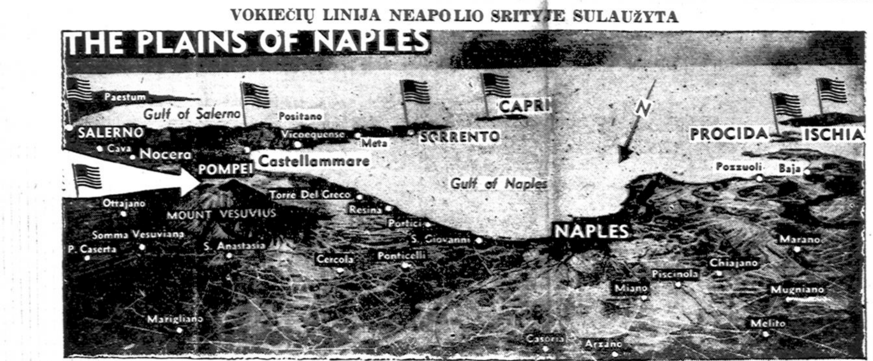
Amerikos Penktoji Armija, vadovaujama gen. M. Clark, nušlavus nuo lygumos vokiečius, įeina į Neapolį. Visas nacių frontas Neapolio srityje pajėgęs. Vokiečiai vieni pasiduoda nelaisvėn, kiti dar stengiasi pabėgti.

RUSAI KLABINA GOMELIO VARTUS NEW YORKAS, spalio 1. —Britų radio šią dieną pranešė, kad rusų kariuomenės jau randasi “prie pat Gomelio vartų.” MASKVA, spalio 1.—Vokiečių kariuomenės smarkiai kovoja rusus, kurie spaudžia nacių pozicijas prie Dniepro upės Vitebske, Mogileve, Gomely ir Kieve. Užėmus Krichevą, kur suena geležinkeliai iš Bryansko ir Roslavlio į Mogilevą, rusai dabar turi stiprų centrą tik 58 mylias nuo Mogilevo, kuris yra nacių gynimo linijų centras pastojas rusams kelią į Lenkiją ir Pabalčio valstybes. Rusai užėmė Krichevą žygiuose, kuriuose jie pasivarė nuo 7 iki 12 mylių tame sektorių ir užėmė suvirį 170 kaimų. Stokholme gautos žinios iš Berlyno sakė vokiečių aukštosios komandos narys pareiškęs jog nacių pasitraukimas Rusijoje “dabar baigtas,” ir kad vokiečiai dabar mano laikyti Dniepro liniją. Anot tos žinios, rusų užimtos teritorijos prieš Kievą ir prie Kremenchugo esančios strateginiai bevertės. Berlynas dar nėra pranešęs apie Kremenchugo užėmimą. Tass'o agentūros radio pranešimas rusų laikraščiams sakė vokiečių laiko ni geležinkelių centrai Vitebske, Orshoje, Mogileve ir Duhankoi buvo trečiadienį bombuoti. Pranešimas sakė tose priešio bazėse nuo bombų buvo daug sprogimų ir kilo dideli gaisrai, ir kad visi rusų lėktuvai saugiai grįžę.