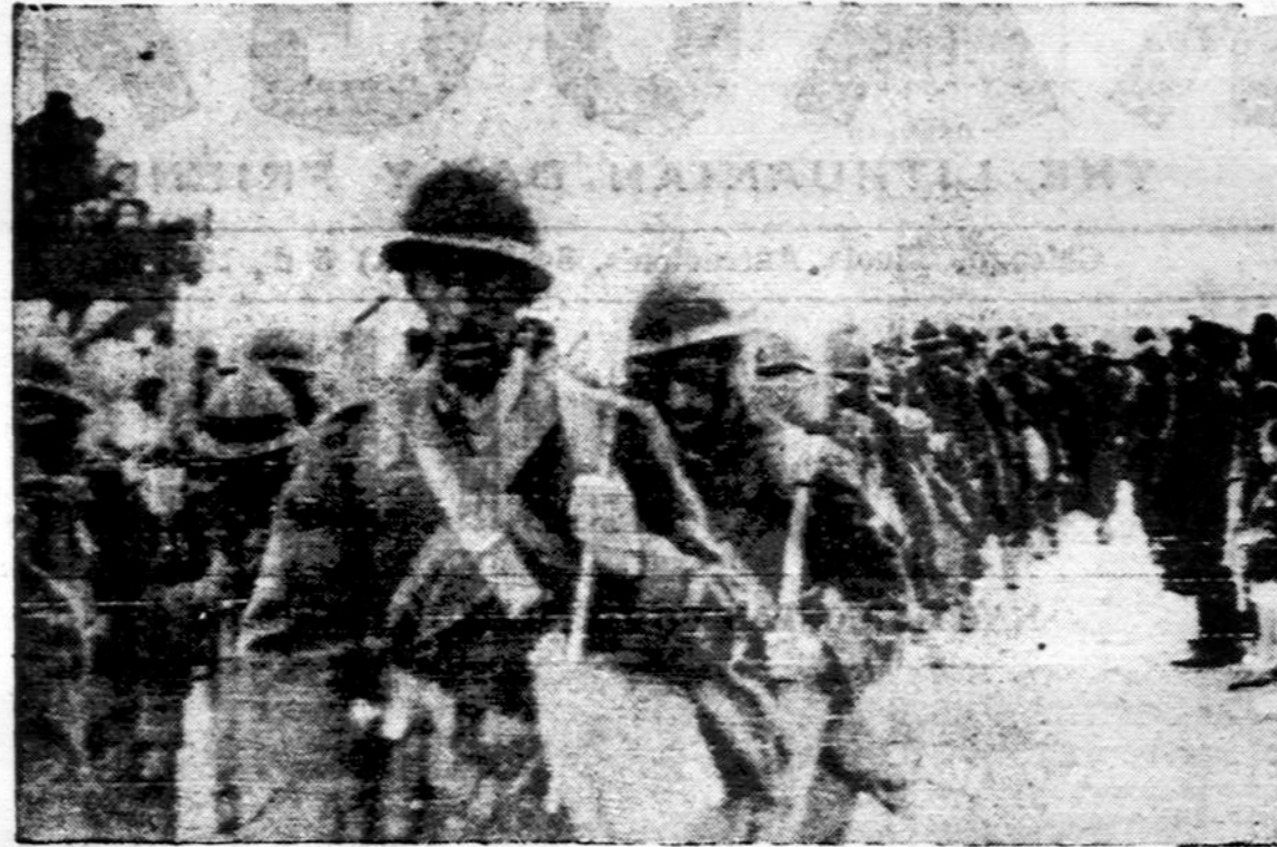
Vienam soste Corsica saloje išlaipinama atgabenta iš Afrikos prancūzų kariuomenė, kad vietos partizanams padėtų greičiau salą apvalyti nuo vokiečių. Sala priklauso Prancūzijai.