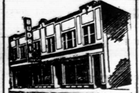
Budriko Moderniška Krautuvė

WCFL 1000 k. Sekmadienio vakare 9 valandą. WFPC 1450 k. Ketvirtadienio vakare 7 valandą.