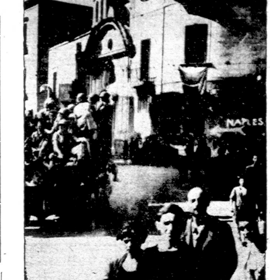
Motorizuota amerikiečių gen. M. Clark Penktoji Armija praeina Napoli sritį ir naikina vokiečius besitraukiančius Romos link.