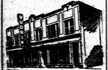
Budriko Moderniška Krautuvė

Radio Programai leidžiami Budriko Krautuvės per 14 metų: WCFL 1000 k. Sekmdienio vakare 9 valandą. WHFC 1450 k. Ketvirtadienio vakare 7 valandą.