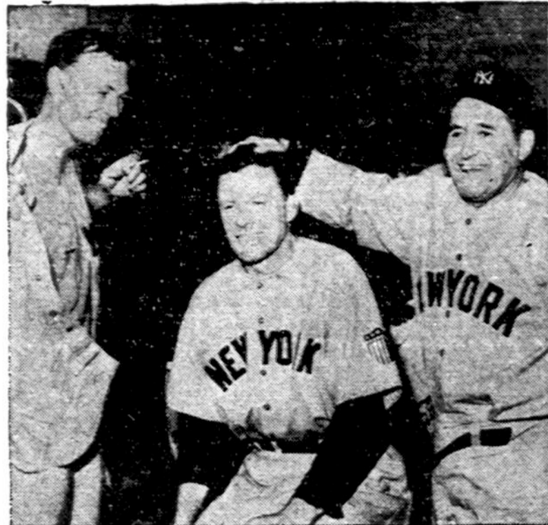
Boss Joe McCarthy, right, has a pat on the head for Spud Chandler, winning pitcher in two games, as Bill Dickey, who clinched last game with a homer, at left, adds grin to make a happy trio.