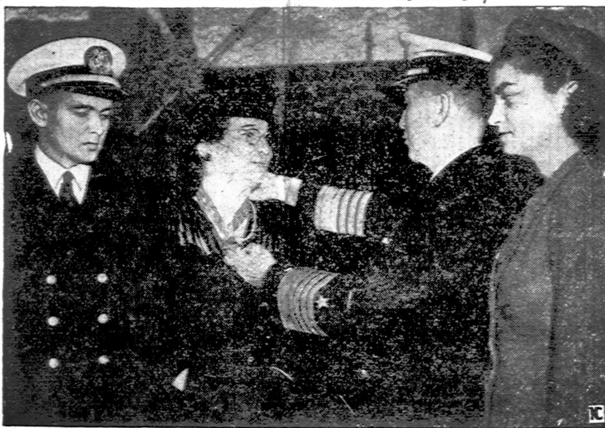
MOTINA PAVADUOJ A KARŽYGI SŪNŲ