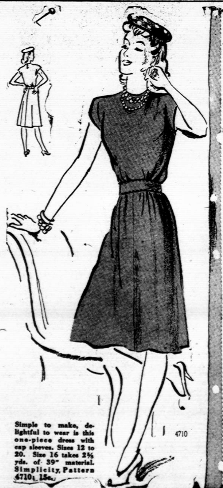
Simple to make, delightful to wear is this one-piece dress with cap sleeves. Sizes 12 to 20. Size 16 takes 2 1/4 yds. of 39" material. Simplicity Pattern 4710, 15c.

Raleigh vyskupas E. McGuinness teikia Sutvirtinimo Sakramentą moterims marinėms (U. S. Marine Corps Women Reserve). Tuo pačiu kartu Sutvirtinimo Sakramentas suteiktas daugiau kaip 90 kariškių moterų ir vyrų.