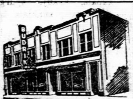
Budriko Moderniška Krautuvė

Marquette Park. — Tėvų Marijonų Bendradarbių 5 skyrius laikys mėnesinį susirinkimą, sekmadienį, spalio 17 d., 2 val. popiet, parapijos svetainėje. Visi bendradarbiai kviečiami ateiti susirinkiman. Valdyba