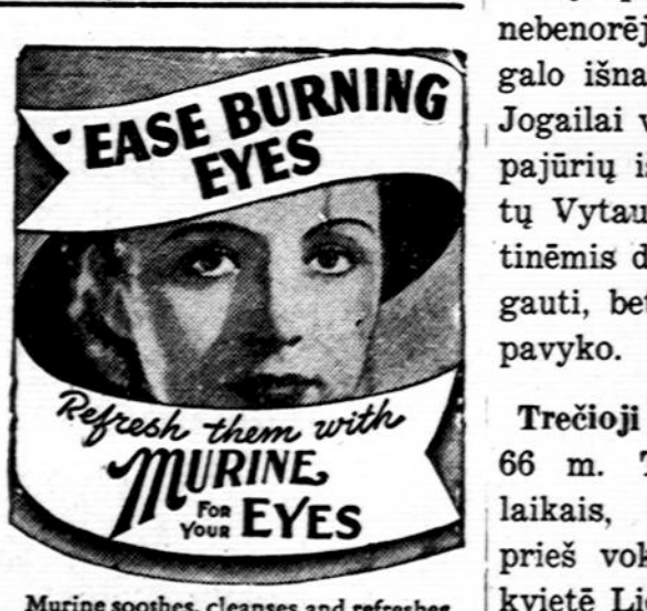
Murine soothes, cleanses and refreshes irritated, reddened membranes caused by head colds, driving, winds, movies, close work, late hours. Free dropper with each bottle. At all Drug Stores.

Chronic bronchitis may develop if your cough, chest cold, or acute bronchitis is not treated and you cannot afford to take a chance with any medicine less potent than Creomulsion which goes right to the seat of the trouble to help loosen and expel germ laden phlegm and aid nature to soothe and heal raw, tender, inflamed bronchial mucous membranes. Creomulsion blends beech wood creosote by special process with other time tested medicines for coughs. It contains no narcotics. No matter how many medicines you have tried, tell your druggist to sell you a bottle of Creomulsion with the understanding you must like the way it quickly allays the cough, permitting rest and sleep, or you are to have your money back. (Adv.)