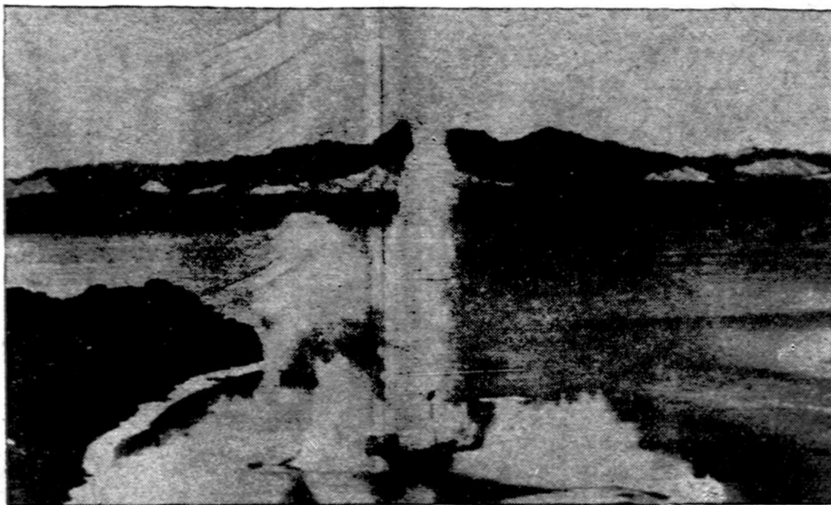
Amerikos Penktojo Oro Skvadrono lakūnai bombomis vaišina japonus jų laivuose Hansa prieplaukoj, New Guinea. Snaikinta mažiausiai 45 įvairaus didumo laivai.