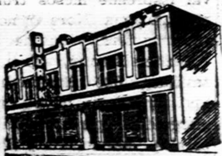
Budriko Moderniška Krautuvė