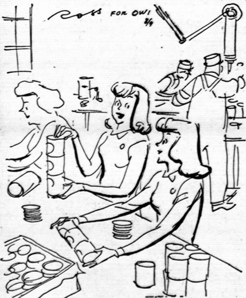
"MY HUSBAND SAYS IF I WORK HERE UNTIL I PUT BACK AS MUCH AS I'VE TAKEN OUT IN MY LIFETIME, THE CROPS CORPS COULDN'T ASK ANY MORE."