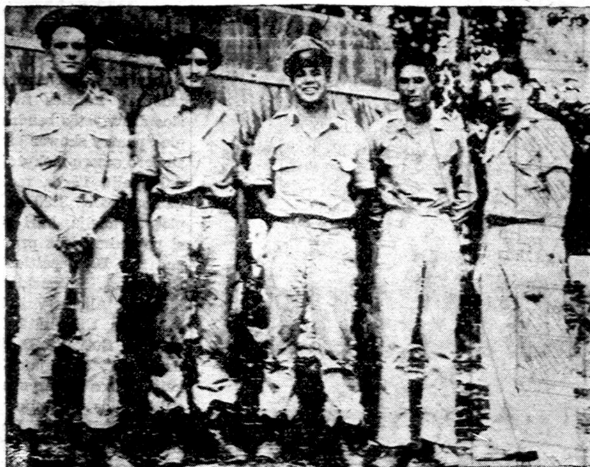
Penki amerikiečių lakūnai, kurie dalyvavo didelėse atakose ant japonų bazės Rabaul, New Britaine. Tai buvus viena didžiausių atakų, kurioje japonams padaryti dideli nuostoliai.

kurių gyventojai aktyviai nuosekliai jūros atžvilgiu. Kas turi daugiau patyrimo ir geresnių garantuotą nepriklausomybei stebėti, tai pasakys, kad pajūrių miestai vis yra ekonomiškai ir kultūriškai veiksmingi už tokią pat didumo kontinentinius miestus, kad pajūrio gyventojas greičiau galvoja, greičiau vaikščioja ir greičiau daro. Pas jį daugiau iniciatyvos, jo galva produktiviškesnė, nes ji vis atsigaivina dinamišku jūros oru, bangų ošimu ir jūreiviško verpeto minčių margumu. Žodžių, jis minta šviežesniu protiniu maistu, greitesne idejų apyvarta. Todėl nepaprastai svarbu Lietuvai prie jūros turėti savo didžiausią miestą ir net sostinę, o visą mūsų 90 km. pajūrį reikia praplėsti ir kiek galima tirščiau apgyvendinti žvejais, vasarotojais, sportininkais ir net smulkiosios pramonės įstaigomis, kad jūros dinamika naudotusi didžiausias gyvenamųjų skaičius.