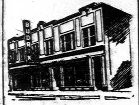
Budriko Moderniška Krautuvė

Rapolas Arkangelas yra gerų kelionių ir draugysčių patronas. Yra gera proga dalyvauti pamaldose ir paprašyti Rapolo Arkangelo, kad jis globotų jūsų sūnus ir vyrus, kurie yra kelionėje ar karo laukuose.