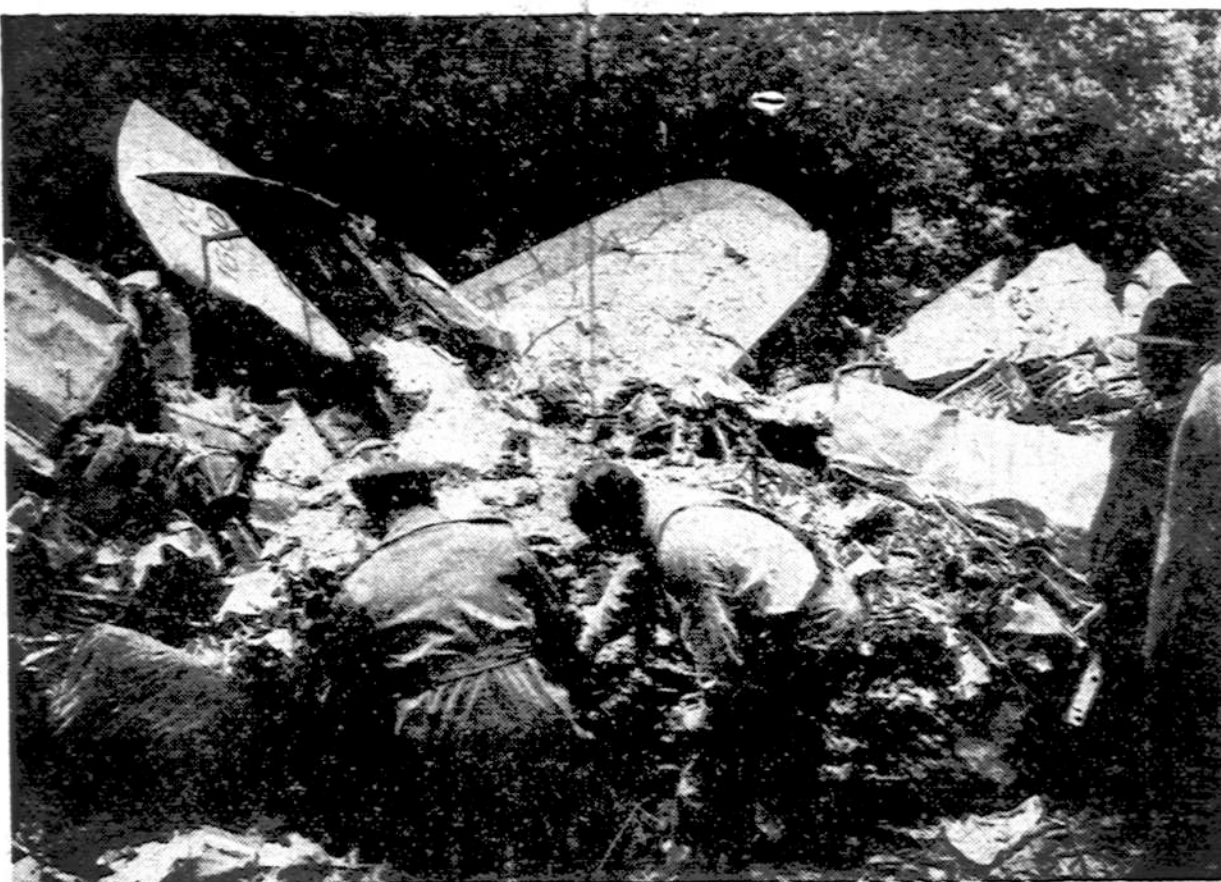
American Airlines vienas lėktuvų nukritęs netoli Centerville, Tenn. Įgula ir visi kareiviai rasti žuvę.