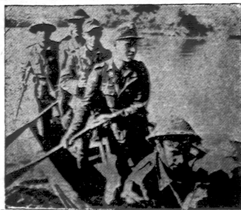
Vokiečių kareiviai, bandę pabėgti iš Volturno upės sek-cijos, Italijoje, britų sugauti ir gabenami į nelaisvę.

Lapkričio 21 d. — pasku-tinė diena naudoti gazolino stampas No. 8, "A" knyge-lėse.