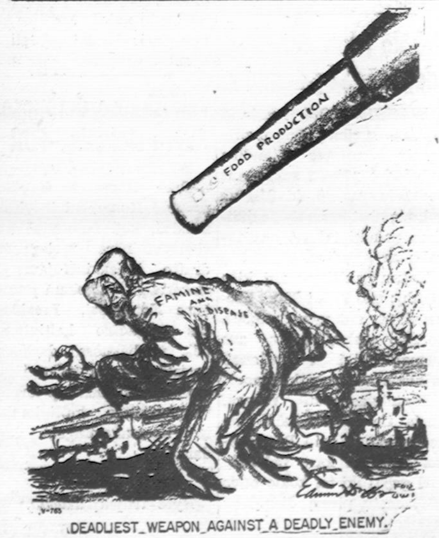
DEADLIEST WEAPON AGAINST A DEADLY ENEMY.

Skaniausia duona yra toji, kurią uždirbame savo rankomis.