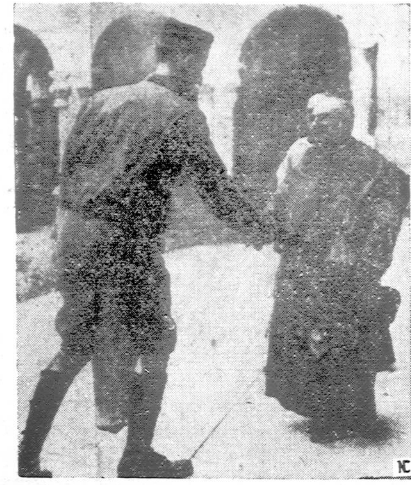
Napoli arkivyskupas pasitinka ir sveikiną Lt. Gen. Mark W. Clark, komendantą Penktosios Amerikos Armijos, atvykusį į katedrą išklausti šv. Mišių. Tai įvyko tuojau po išlaisvinimo miesto iš nacių teroro.