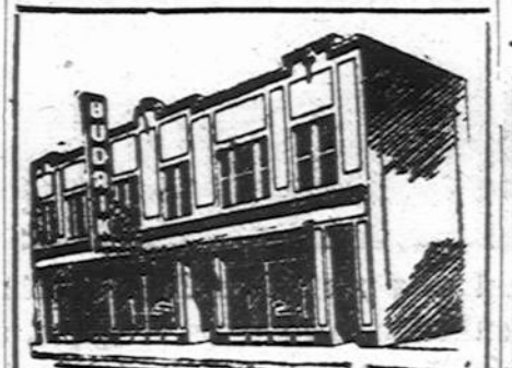
Budriko Moderniška Krautuvis

bet ir seseris Pranciškietės, kurios pasišventė darbuotis prie Pacifiko, lietuvių gero- vei. Dabar jos galės lankyti ir tolimesnes lietuvių šeimas nes nupirkta automobilis palengvins susisiekimą. Čia turiu priminti, kad mašina kaštuoja $700, o iki šiol su- rinkome $314. Todėl trūksta $386. Prašau visų pagel-