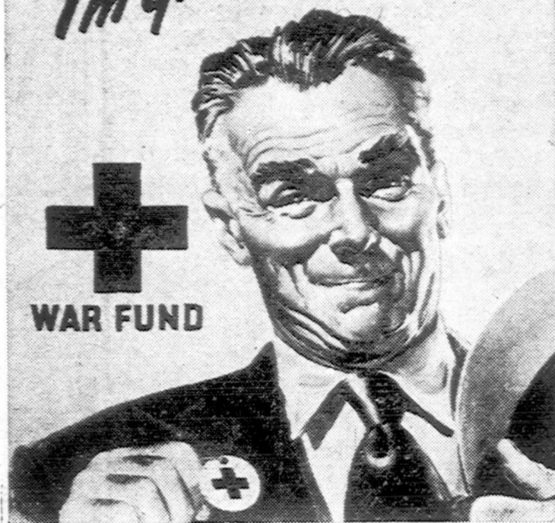
Indicative of the spirit with which Americans will respond to the 1943 Red Cross War Fund appeal is this poster by Wendell Kling, noted illustrator. The cheerful individual pictured is proudly displaying the new Red Cross label tag, made from paper to help