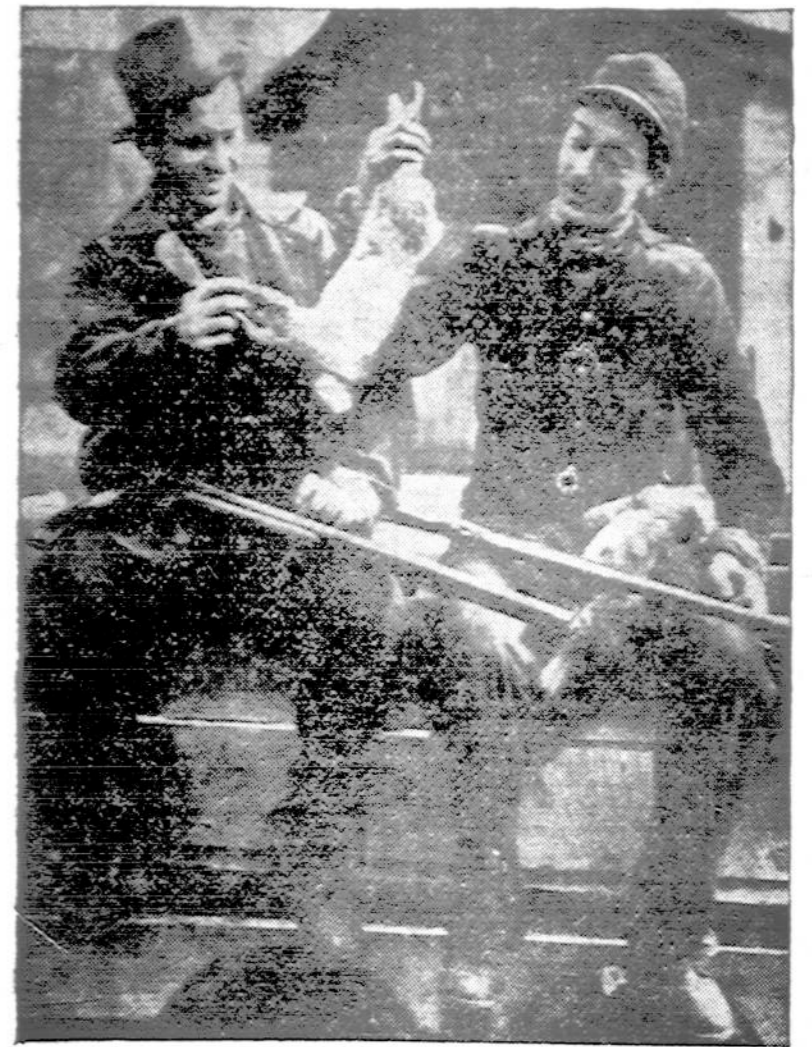
Anglių kasykloms užsidarius dėl darbininkų streiko, šie du anglikasiai iš Pittsburgh, Pa., medžioja zuikius.