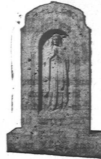
Mūsų pastatytas TĖVAMS MARIJONAMS

Perkėlė savo Raštinę į BRIGHTON PARKĄ Su Income taksais ir kitais reikalais kreipkitės viršminėtu antrašu.