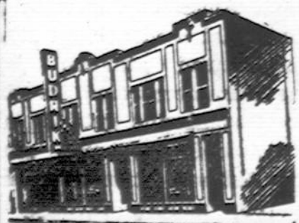
Budriko Moderniška Krautuvė

Tikėjimas yra brangi Dievo dovana amžinajam gyvenimui laimėti. Bet žmogus praranda tikėjimą dėl to, kad jo nebrangina.