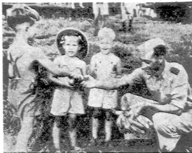
Amerikos vaikai, japonų internuoti nuo karo pradžios, dabar per neutralės šalis gražinami namo. Čia jie džiaugiasi bananais, kuriais Portugalų Indijos policininkas apdovanojo Mormugao saloje.