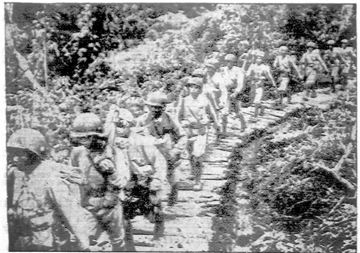
Amerikos karininkų išlavinta ir Amerikos ginklais apginkluota ši kinų kariuomenė eina primityviu keliu užimti pozicijas Burma fronte.