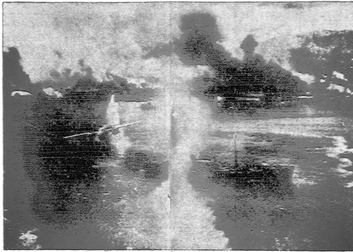
Amerikos bomberiai, kaip B-25 kairėje-centre, neseniai atliko sėkmingą puolimą Rabaul Harbor, kur bombomis sukėlė gaisrus ir stoviniuose japonų laivuose ir uoste. Nuotrauka padaryta po bombardavimo.