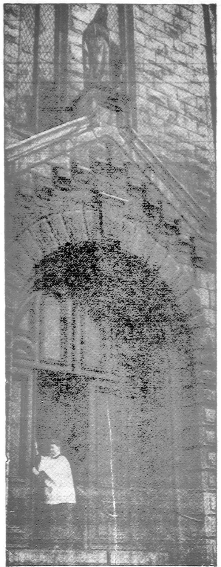
Tai Sv. Marijos bažnyčia, Chicago vidurmiestyje, prie 9 ir Wabash gatvių, dabar pavesta Tėvų Paulistų Kon- gregacijai administruoti. Toje bažnyčioje sekmadieniais galima pasiklausyti garsaus visoje Amerikoje Paulistų choro giedojimo.