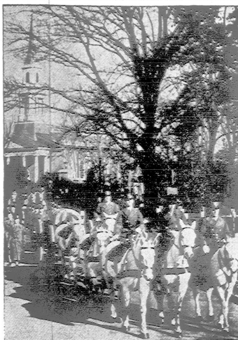
Dvi britų kariuomenės moterų skyrė lakūnės militariškai laidojamos Arlington kapinėse, šale Washington, D. C. Jos žuvo automobilio nelaimėje Washington.