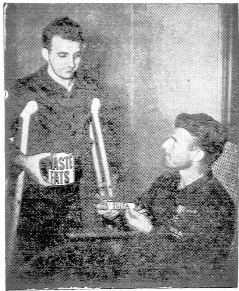
Visi ir visai taupo taukus, kurie reikalingi karo reikalams.

laikyti gyvybę ir papildyti savas jėgas prie darbo, tai tas maisto perteklius susikrauja žmogaus kūne pavaldale riebalų. Žmogus ima tukti.