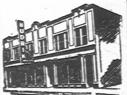
Budriko Moderniška Krautuvs

Jaunuoliai, kurie neprimami karo aviacijos skyry iš priežas- ties spalvų neregėjimo — (color blindness), kreipkitės prie manęs. Apsilimu išgydyti.