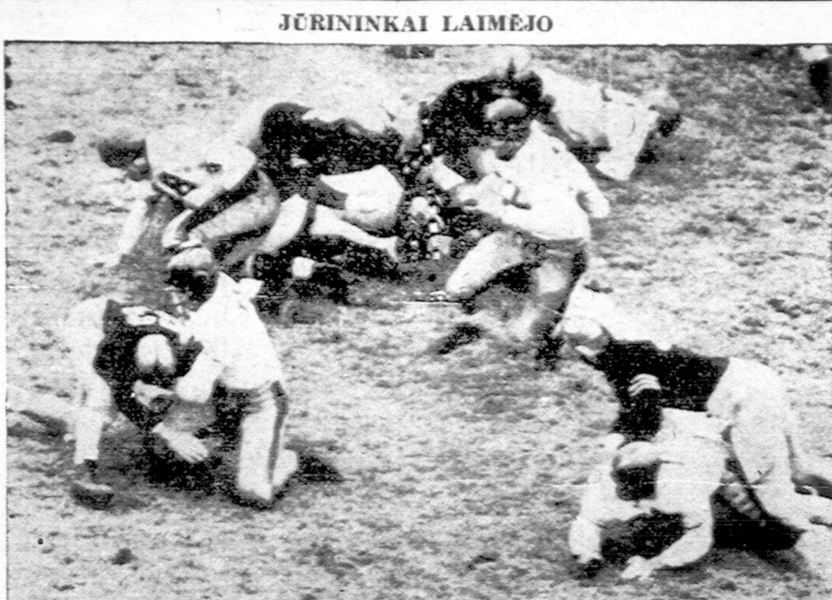
Kariuomenės ir jūrininkų futbolo rinkinių žaidimo nuotrauka, padaryta tuo metu, kada laimėjimas nusiviro jūrininkų pusėn. Jūrininkai laimėjo 13 prieš kariuomenės 0. Žaidimas buvo West Point stadione.

Pereitą pirmadienį policija ieškojo kailinių vagių, kurie pavogė penkis kailių paltus už $1245 įvairiose Chicagos miesto dalyse.