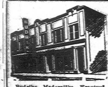
Budriko Moderniška Krautuvė Pilnas didelis pasirinkimas namams rakandų, gerų Parlor Setų, Pečių, Karpetų, Radijų ir didelė Jewelry Krautuvė sykiu su Rakandų Krautuve po vienu stogu. Taipgi Rekordai, Gaidos.

Verta dėmesio ir mums įkvėpimo galinti duoti yra (1919 m. geg. 4 d. ministrų kabineto patvirtinta) Lietuvos kareivio priesaika. — Aš prisiekiu Aukščiausiam Viešpačiui Dievui teisingai tarnauti Lietuvos kariuomenėje... Prisiekiu, nesigailėdamas savo sveikatos nei gyvasties, ligi paskutiniam kraujo lašui ginti Lietuvos laisvę ir nepriklausomybę, o taip pat mūsų žmones ir visą mūsų žemę nuo kokių nors užsienių ar vidaus priešų užpuolimo ir nuo visų tų, kurie mūsų krašte kels riaušių, ardydys žmonių darbą ir ramumą ar kitąjį