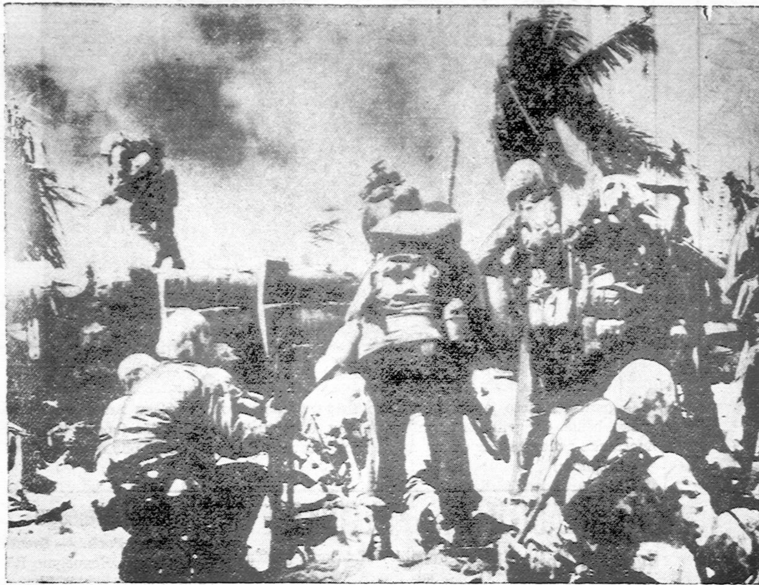
Amerikos marinų didžiausias heroizmas buvo parodytas barikadų išlips ant kranto šie vadinami "Velnio šunės" (Devildogs) marinai puolė japonų gerai įstiprintą aerodromą Tarawa saloje, nežiūrėdami baisaus šaudymo švina ir "krūviniausiam mūšyje visoj istorijoj", kuomet iš silpnų