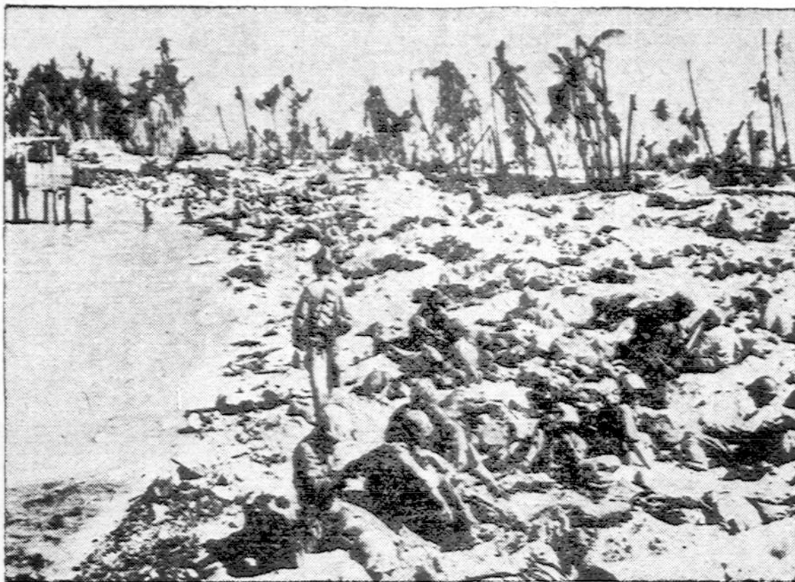
Po vienos kruviniausių kovų ant Tarawa salos kranto išlikę gyvi Amerikos marinai sukritę ant žemės trumpai valandėlei pasišėti. Ši nuotrauka parodo visą Tarawa salą, kur aukščiausia vieta yra 12 pėdų aukščiau jūrų paviršiaus. Bendras salos aukštumas yra šešios pėdos aukščiau jūrų paviršiaus. Oras todėl begalo drėgnas, sloginantis ir tokiame klimato veisiasi miriadai uodų, kurie ne tik žmogų ėda, bet ir malarija užkrečia.