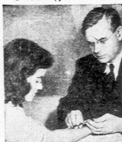
High school girl, above, receives tuberculin test from doctor. Tuberculosis associations, supported by Christmas Seals, help guard health of school children.