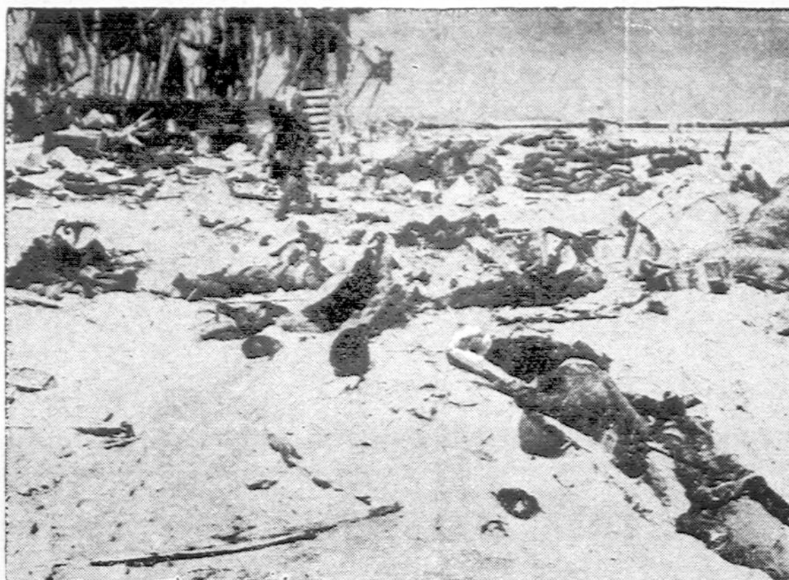
Iš gerai įstiprinto japonų garnizono Tara wa saloje, po didvyriškų Amerikos marinių atakų, beliko tik griūvėsiai, smėlis nudažytas aziatų krauju ir eilės japonų lavonų. Ši nuotrauka padaryta dar einant smarkioms kovoms.