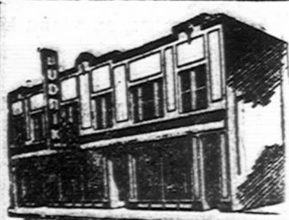
Budriko Moderniška Krautuvė

Po puotos jaunieji išvažiavo į Rytus — povestuvi nei kelionei.