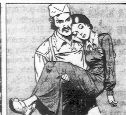
— Kur tu Ją matai? —