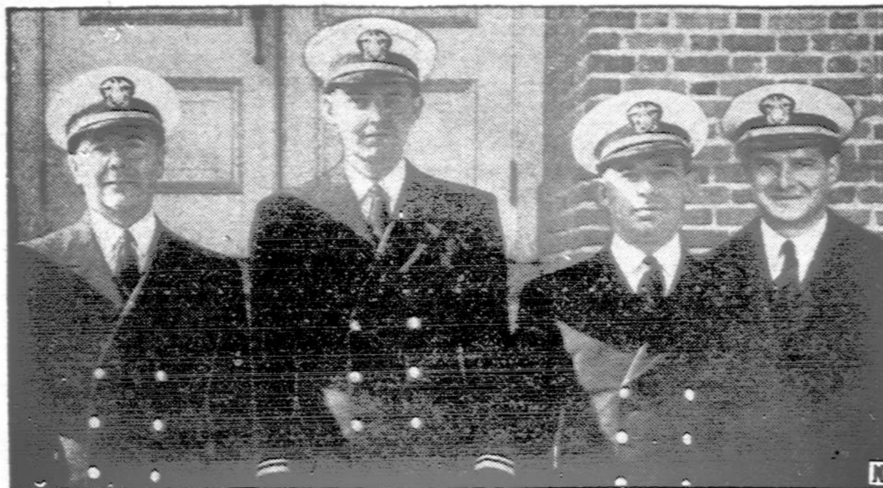
Keturi katalikų kunigai iš Troy, N. Y., baigę Naval Training School for Chaplains, esančią Williamsburg, Va., ir jau paskirti pareigoms.