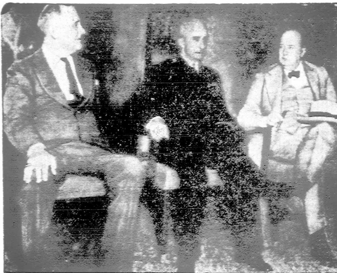
Po trijų dienų konferencijos Jungtinių Tautų vadai su Turkijos prezidentu Ismet Inonu, nusifotografavę spaudai. Atvaizde generalissimo Chiang Kai-shek, prez. Roosevelt, ministrų pirm. Churchill ir Turkijos prez. Ismet Inonu.