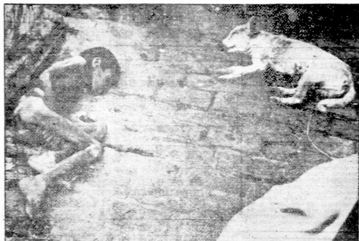
Viena iš daugelio šurpių scenų Calcutta, Indijoje: vaikutis ir jo draugas — šunelis sykiu kritę nuo bado. Apskaitoma, kad per spalį ir lapkričio mėnesius, kaip badas buvo pasiekęs aukščiausį laipsnį, krito virš vienas milijonas žmonių.