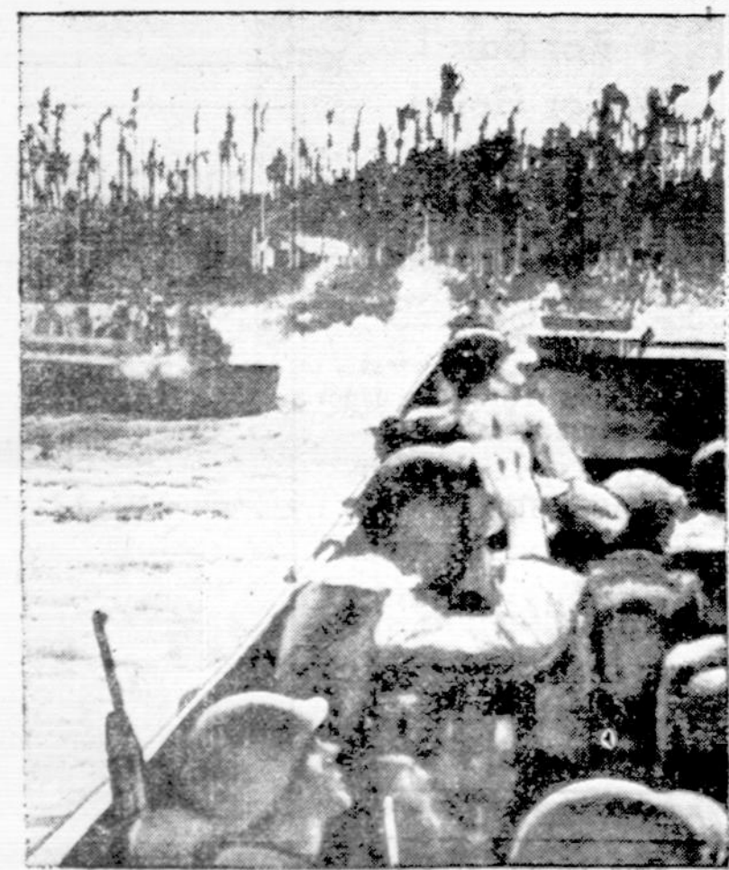
Arawe apylinkės pakraštyje Amerikos kariuomenė laiveliais išsodinama New Britain saloje. Priešakyje kareiviai stebi japonų lėktuvus, kurie už sekundės pradėjo atakuoti mūsų pastangas.